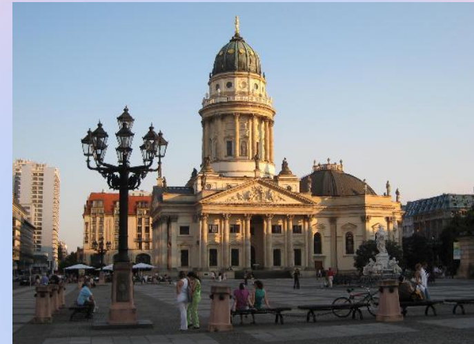
Deutscher Dom 9 €