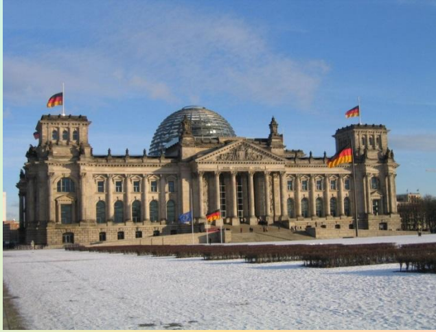
Reichstag building 25 €