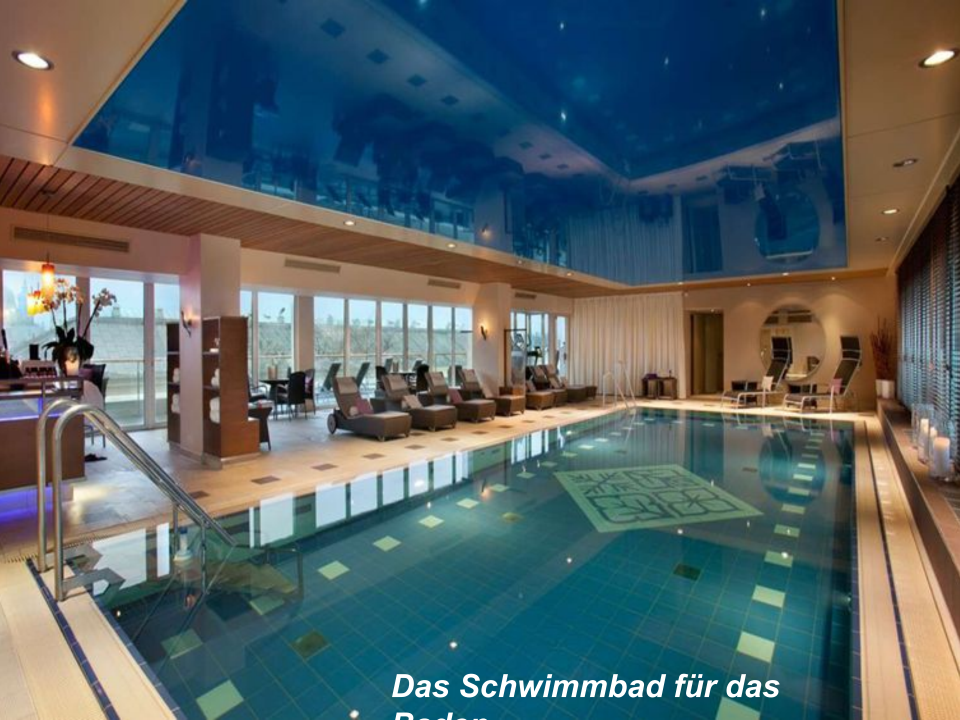
Das Schwimmbad für das Baden