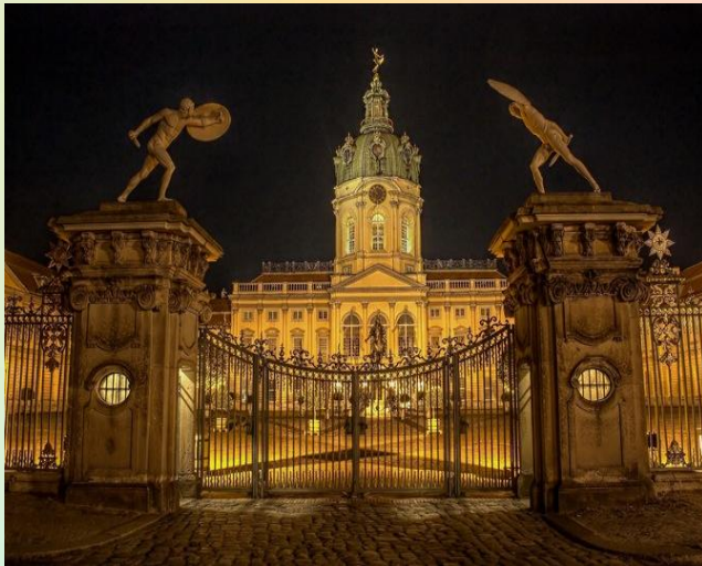
Schloss Charlottenburg 7 €