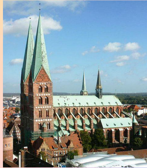
Marienkirche 18 €