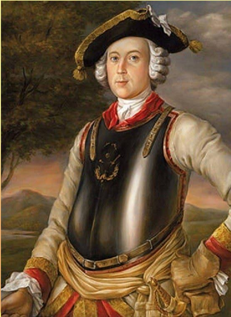
Baron von Münchhausen

Титулы аристократов стали частями составных фамилий в Германии. Такие фамилии часто включают в себя частицу «von», «von der», «von dem» «zu».