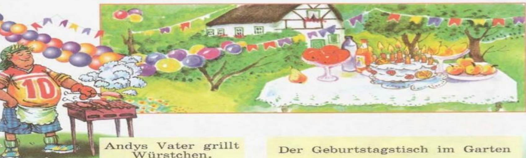
Andys Vater grillt Würstchen.

a) Schaut auf die Bilder. Was und wen seht ihr da?