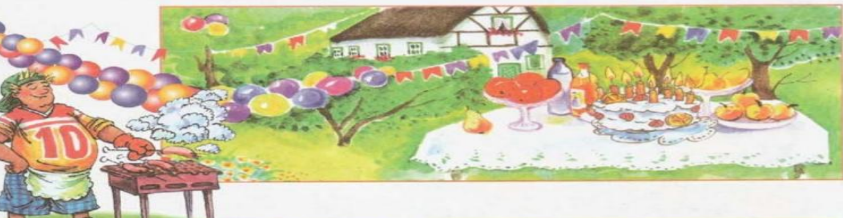
Andys Vater grillt Würstchen.

a) Schaut auf die Bilder. Was und wen seht ihr da?