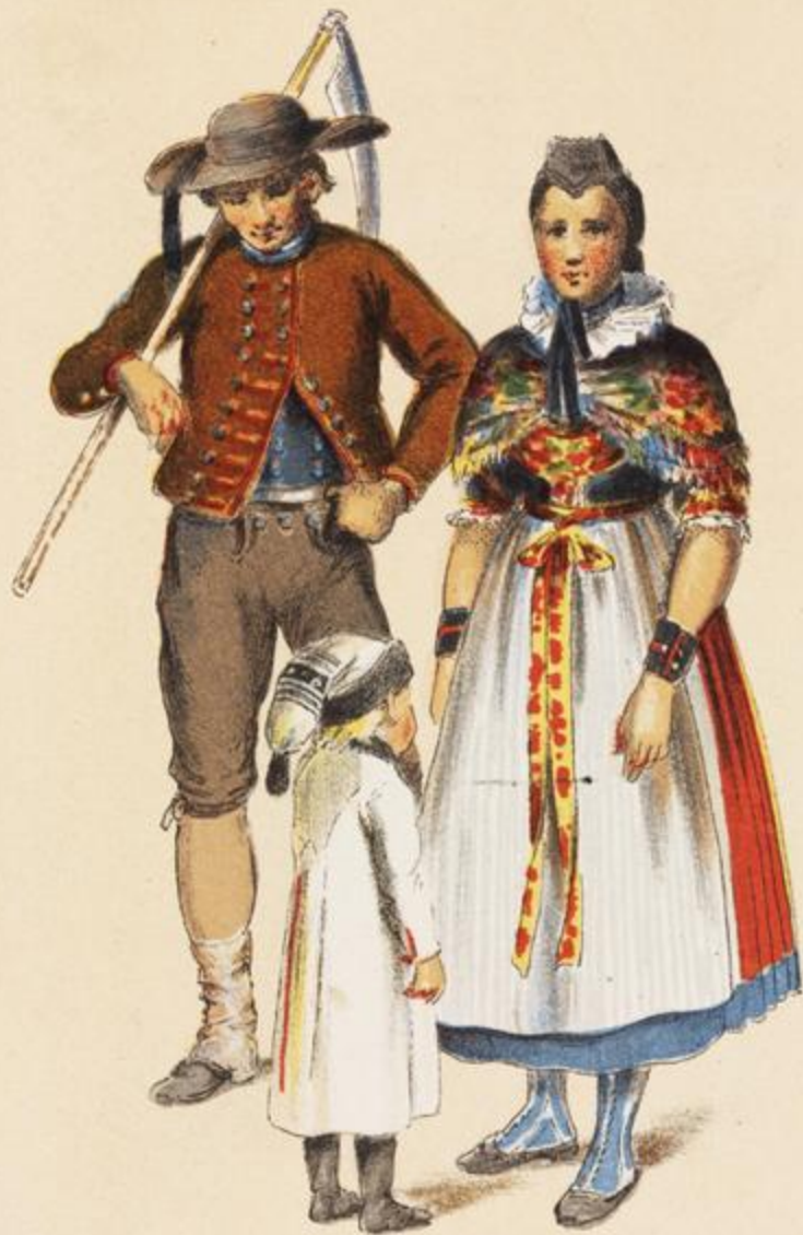
LOWER HESSE CASSEL Nerndorf.