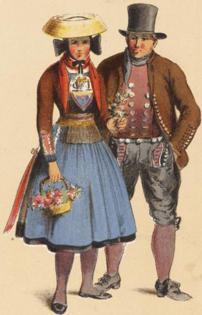
VIERLANDE near Hamburg.