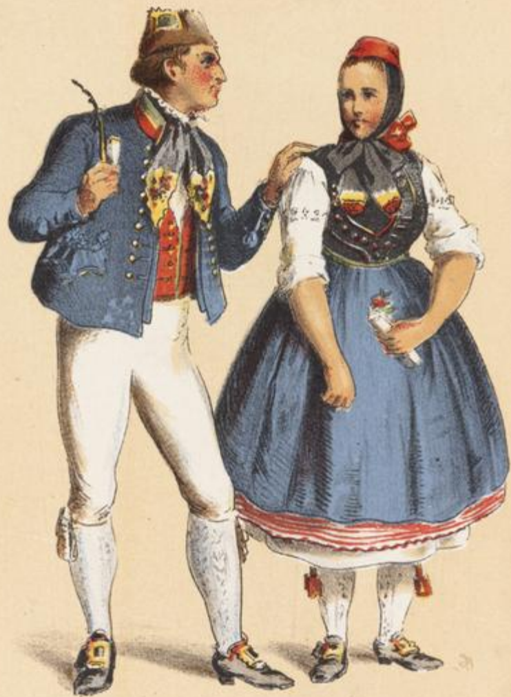
HESSE CASSEL on the Schwalm.