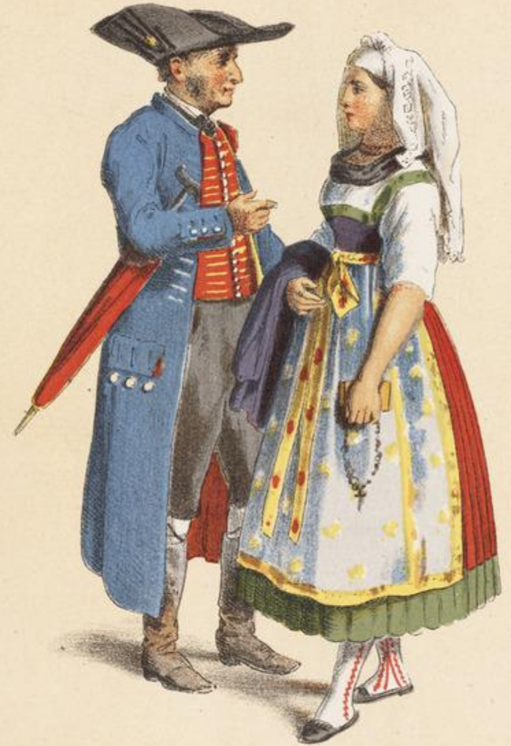
BAVARIA Franconien Switzerland.

? Am Ende XIX Jahrhundert gebort Farblithographietech nik, chromolithograph (aus dem Griechischen chromos-Farbe)