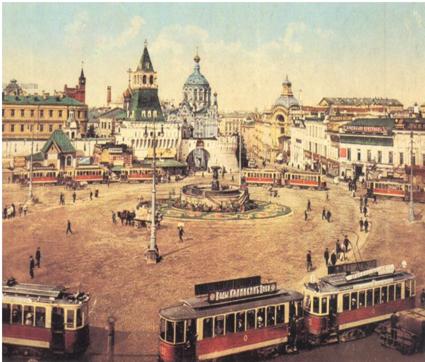
Лубянская площадь.

Aus einer kleinen Festung wurde Moskau zu einer grossen und schönen Stadt. Das Gesicht der Stadt spiegelt ihre Geschichte wider.