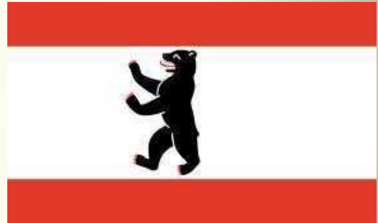
Die Fahne Berlins