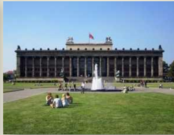
Das Alte Museum