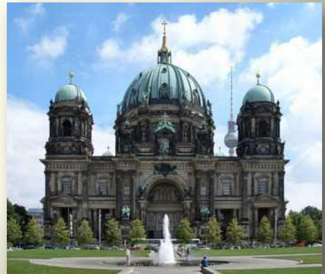
Der Berliner Dom