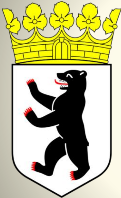
Das Wappen Berlins