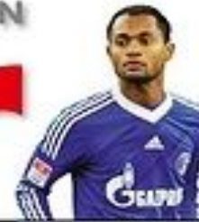
SCHALKE 04 RAFFAEL Zwischen Genie und Phlegma