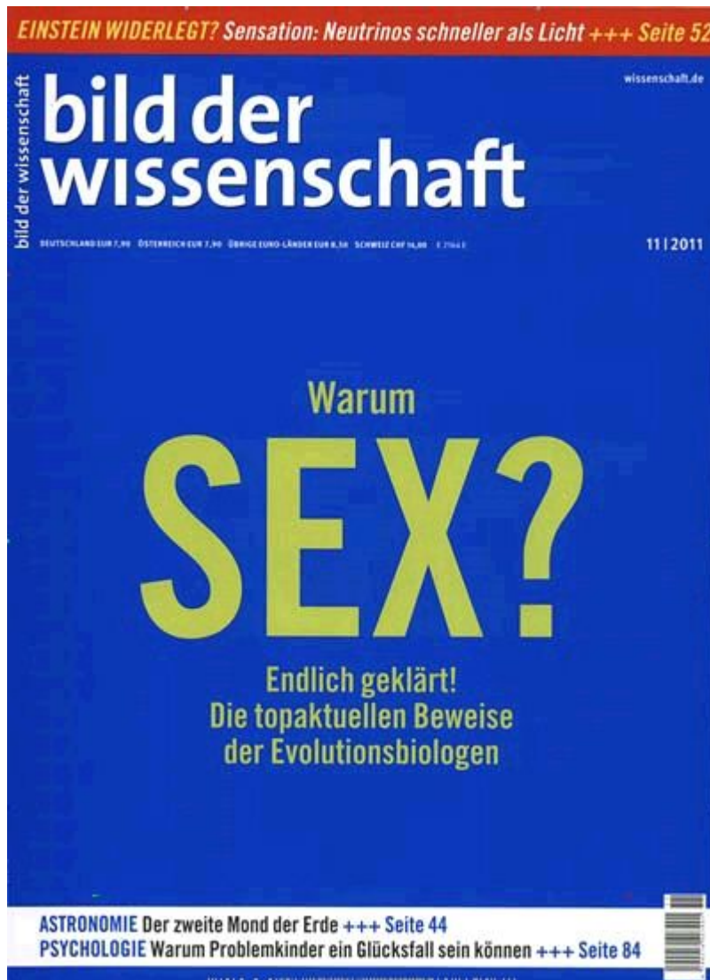
Bild der Wissenschaft