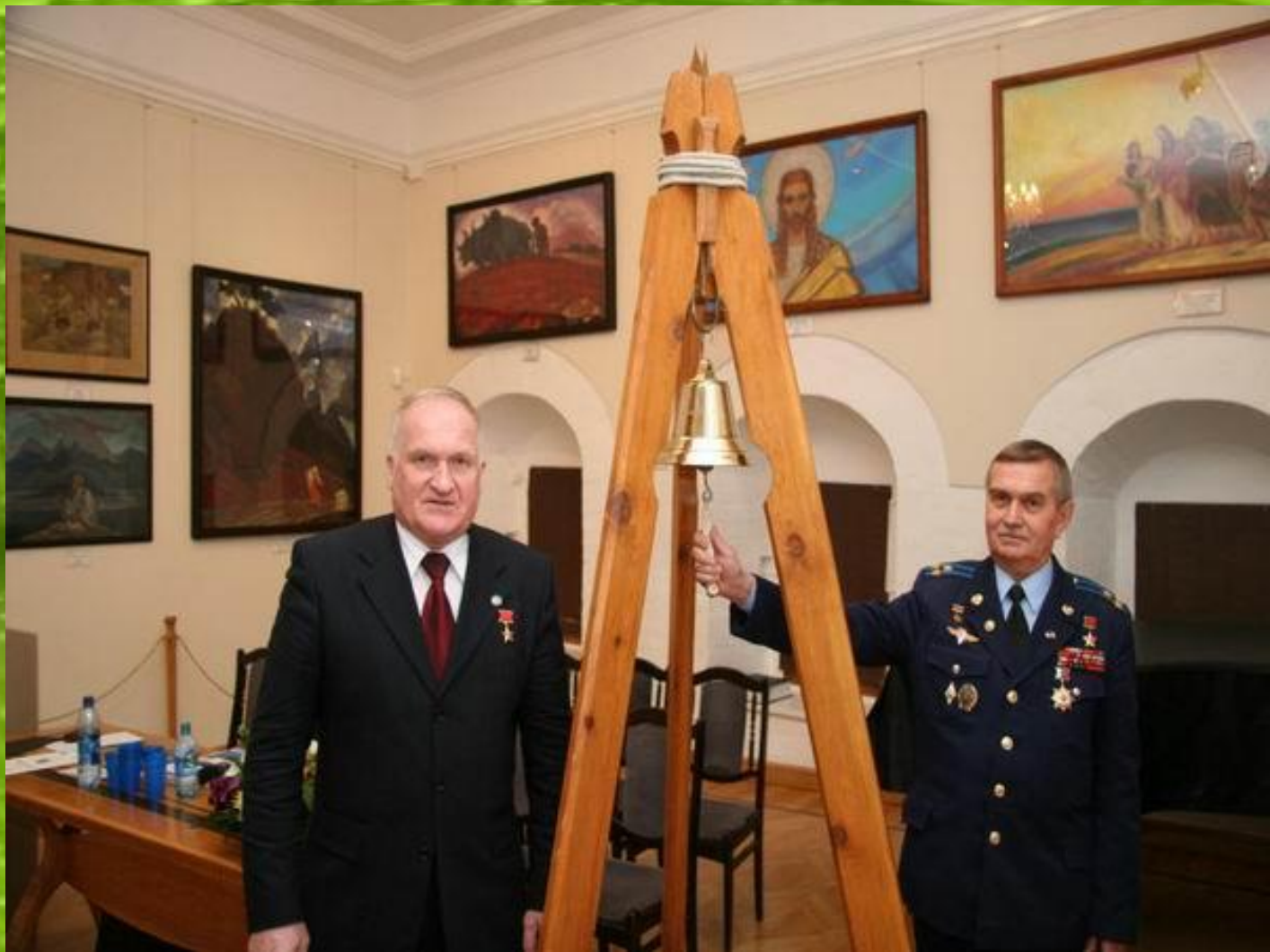
На фото: лётчики-космонавты В. М. Афанасьев и А.Н. Березовой