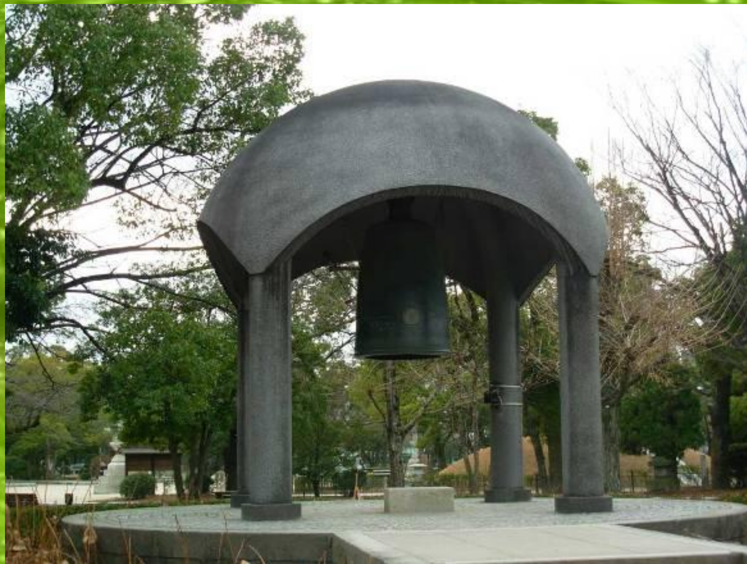
Первый Колокол Мира