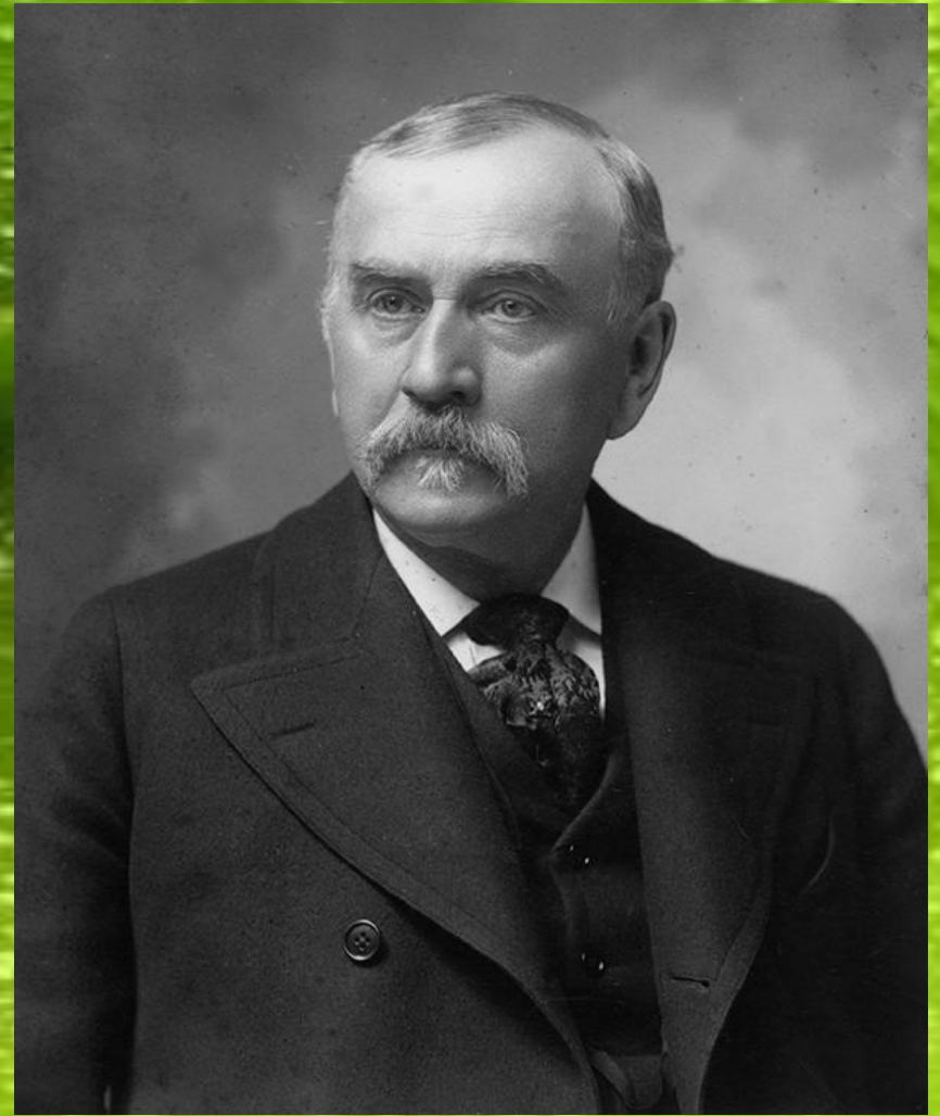
Джон Стерлинг Мортон