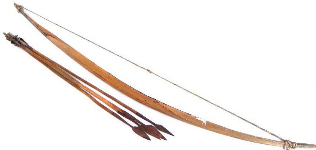
Лук и стрелы