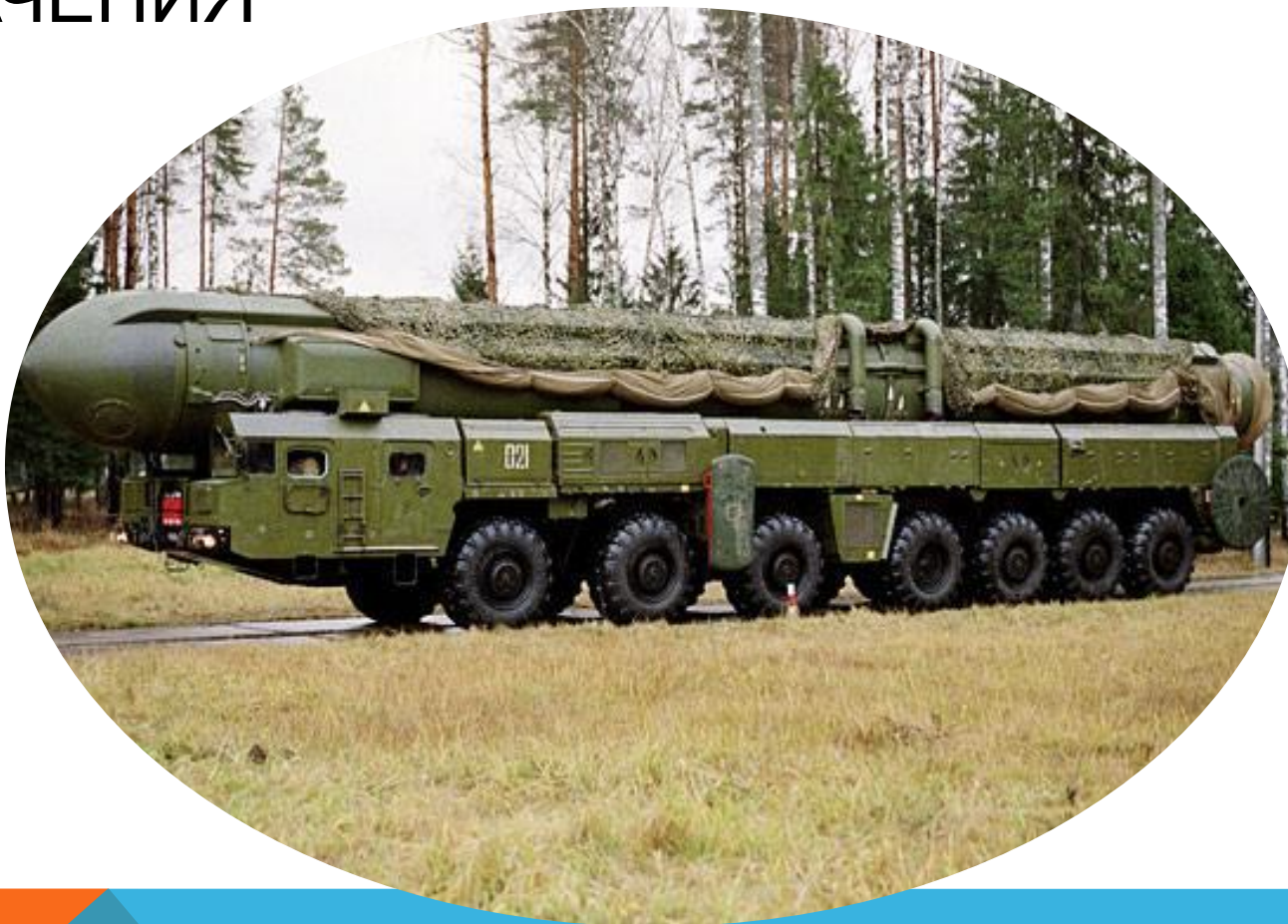
Машина боевого управления