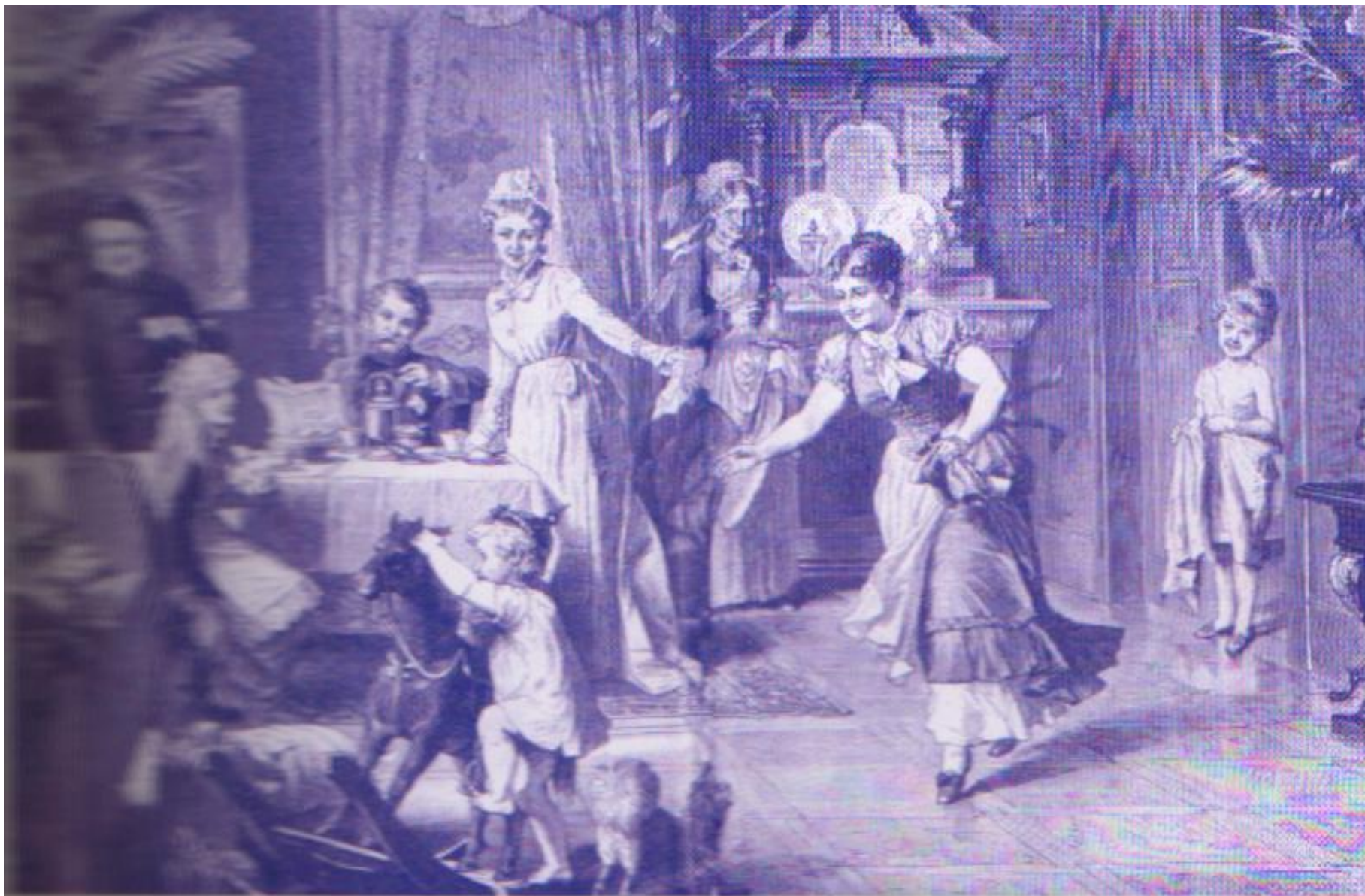
Иллюстрация: «История искусства» 1885 г.