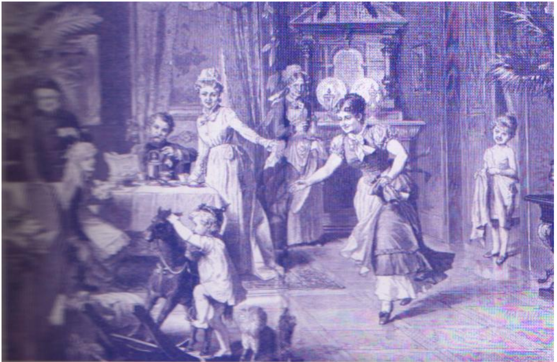
Иллюстрация: А. С. Савицкий. 1885 г.