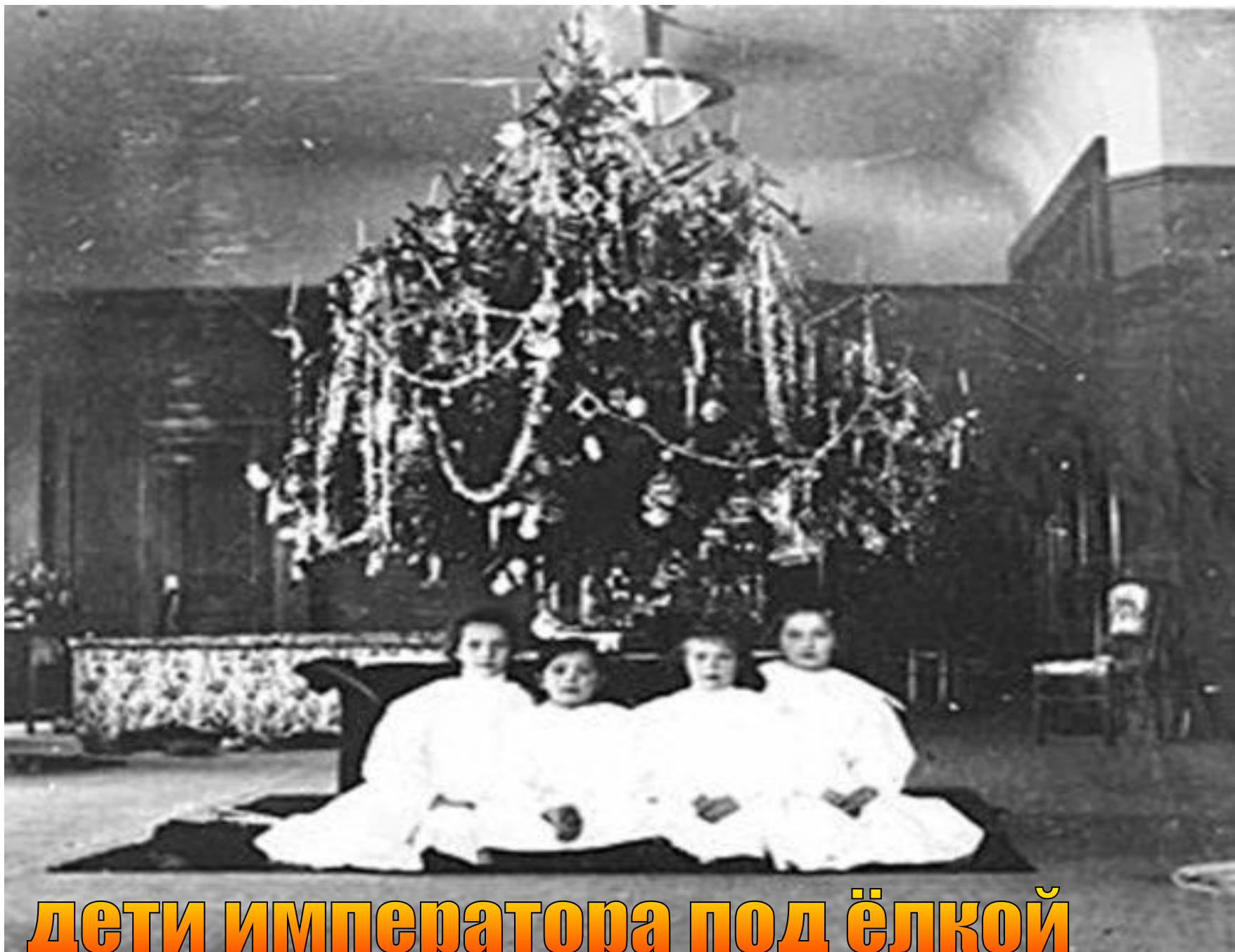
дети императора под ёлкой