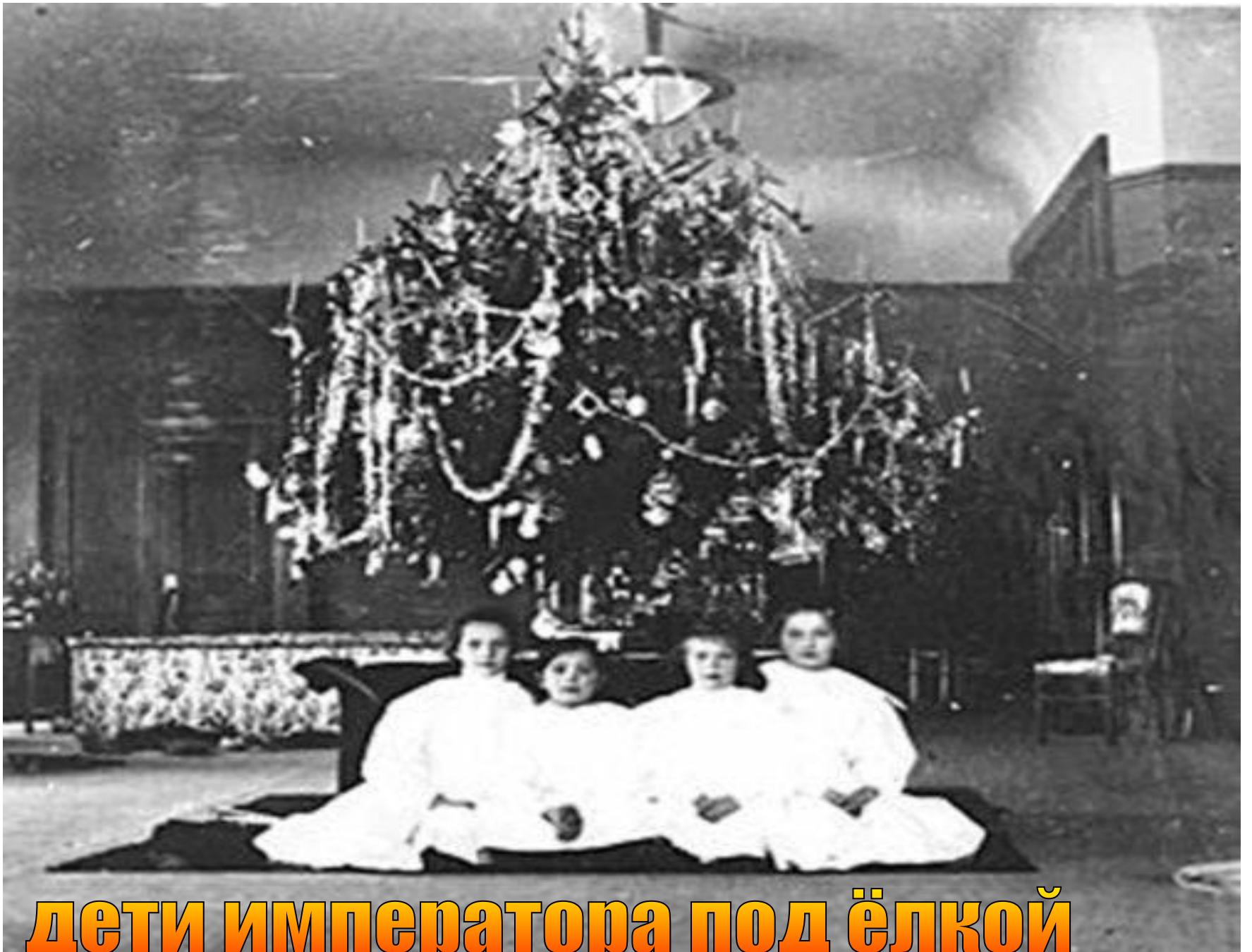
дети императора под ёлкой