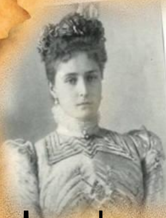
императрица Александра Федоровна