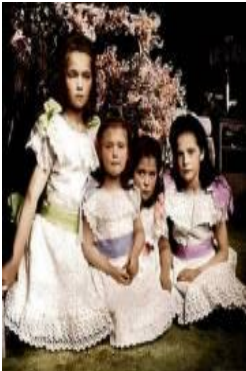
дети Николая II