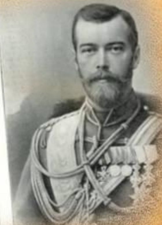
император Николай II