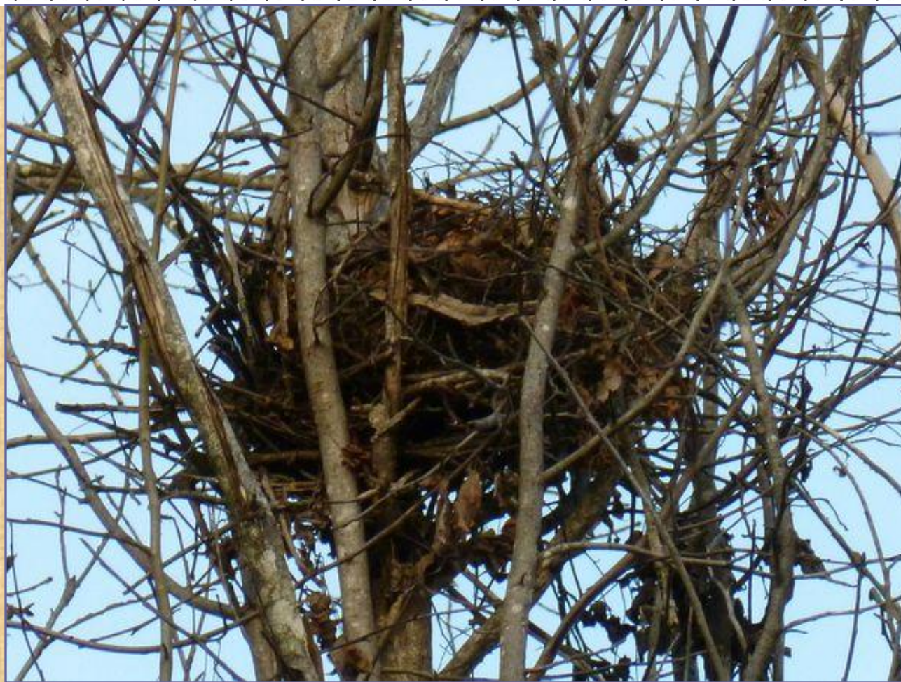
Гайно - гнездо белки