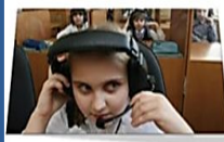
Мобильный кабинет «Диалог-М»