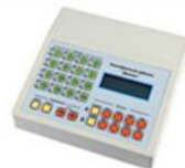
Мобильный кабинет «Диалог-М»