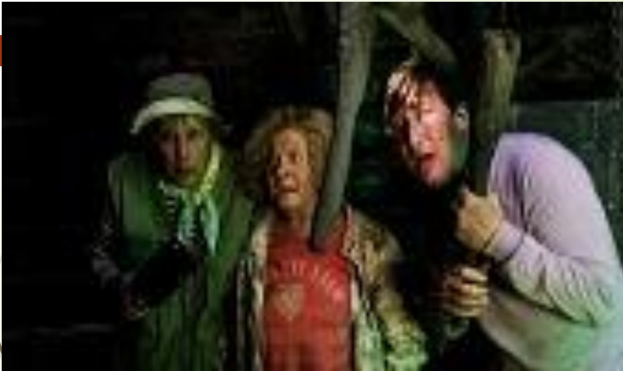
Кадр из фильма «Пока цветет папоротник» (2012 год)