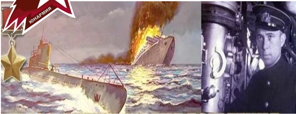
Подвиг К-23 под командованием капитана 3-го ранга Леонида Потапова