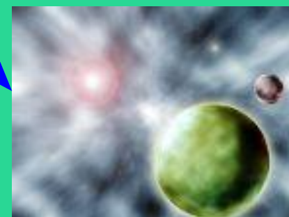
луна, звезды, солнце