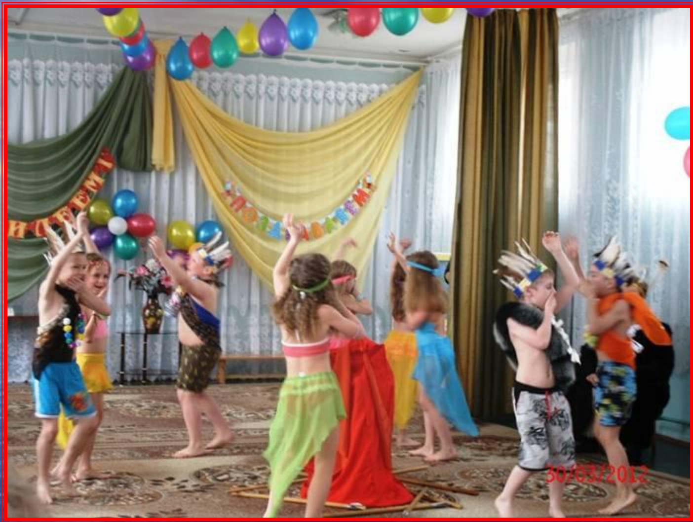
Танец "Пещерные люди"