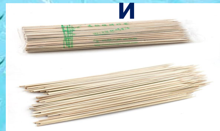
• «Бамбуковые палочки»