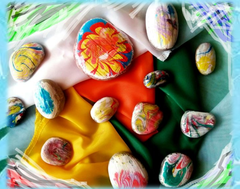
Рисунок Эбру можно перенести не только на лист бумаги, но на различные материалы (дерево, гипс, ткань, камень и другие варианты)...