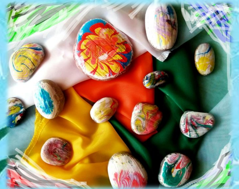
Рисунок Эбру можно перенести не только на лист бумаги, но на различные материалы (дерево, гипс, ткань, камень и другие варианты)...