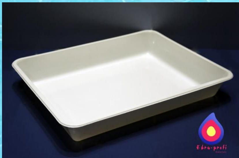
• «Лоток» для раствора