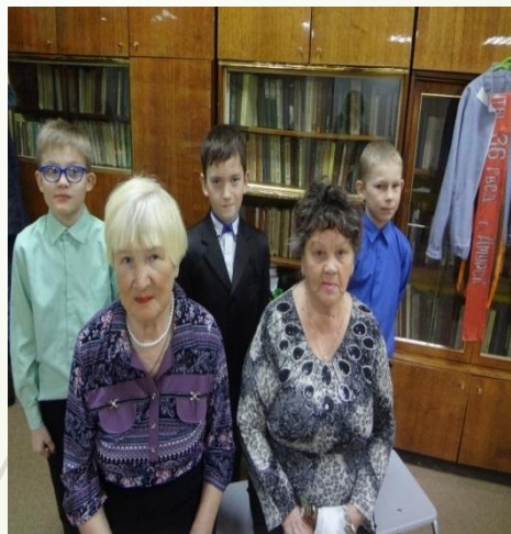
Совет ветеранов образования