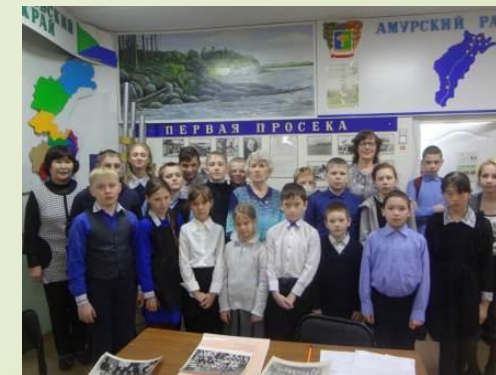
Со старшим звеном и первостроителями