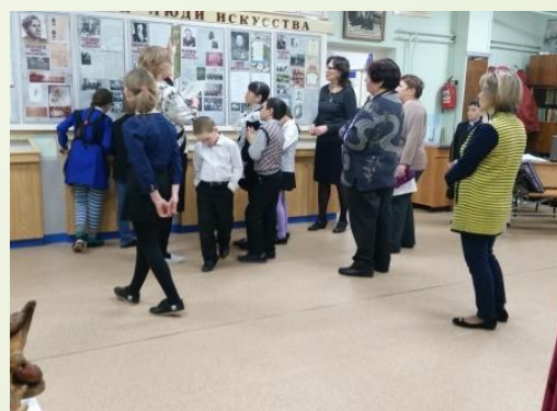
Совет ветеранов г. Хабаровск, г. Амурск