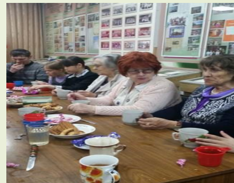
Ветераны образования и родители