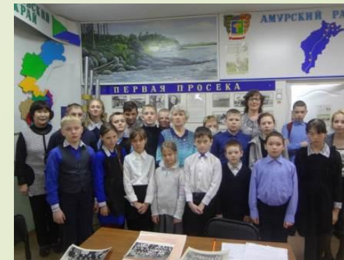
Со старшим звеном и первостроителями