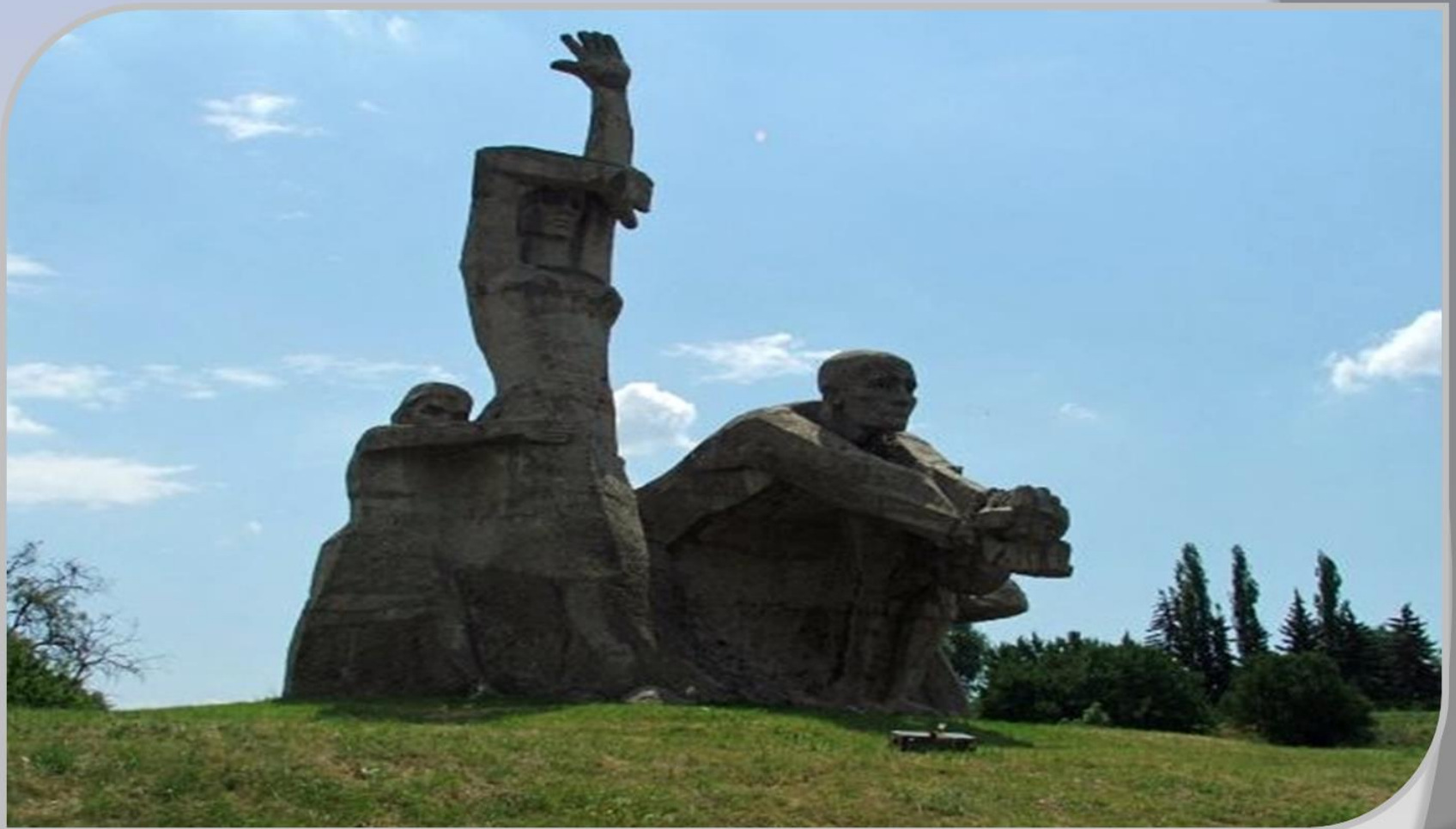
Мемориальный комплекс в Змеевской балке, Памятник 27 тысячам казненных жителей Ростова-на-Дону