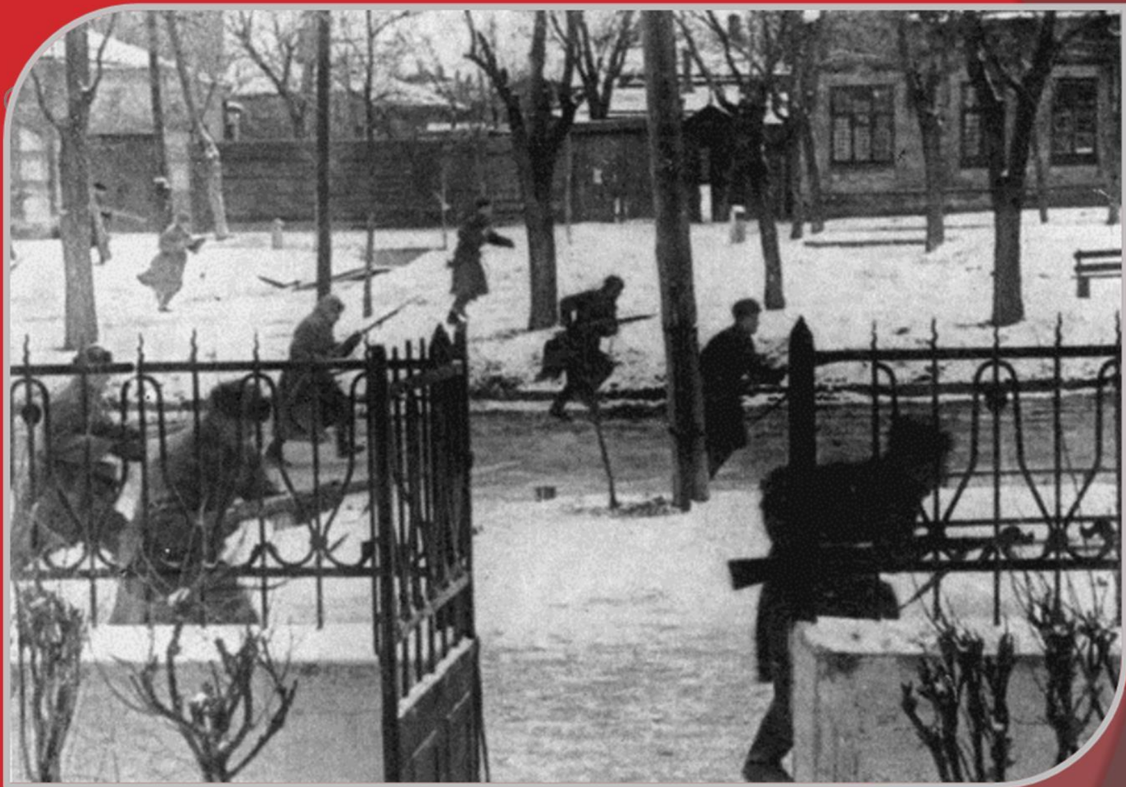
Бегущие бойцы по улице Пушкинская