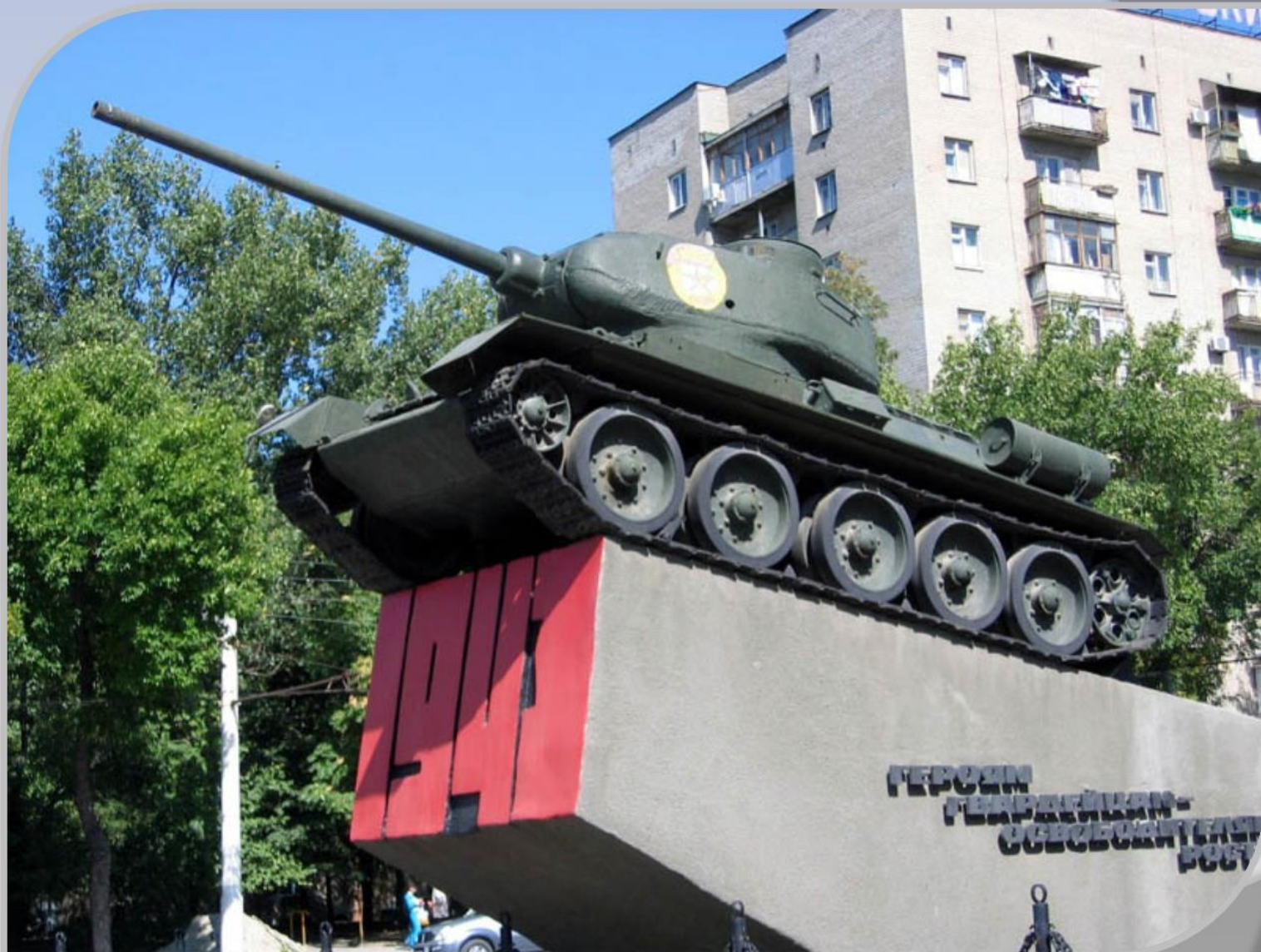
Памятник на Гвардейской площади, посвященный освобождению Ростова-на-Дону