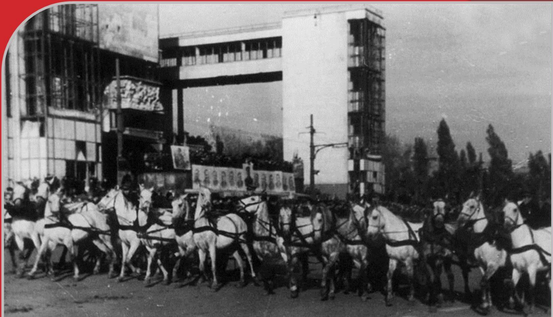
Парад победы в Ростове на Театральной площади 14 октября 1945 года.