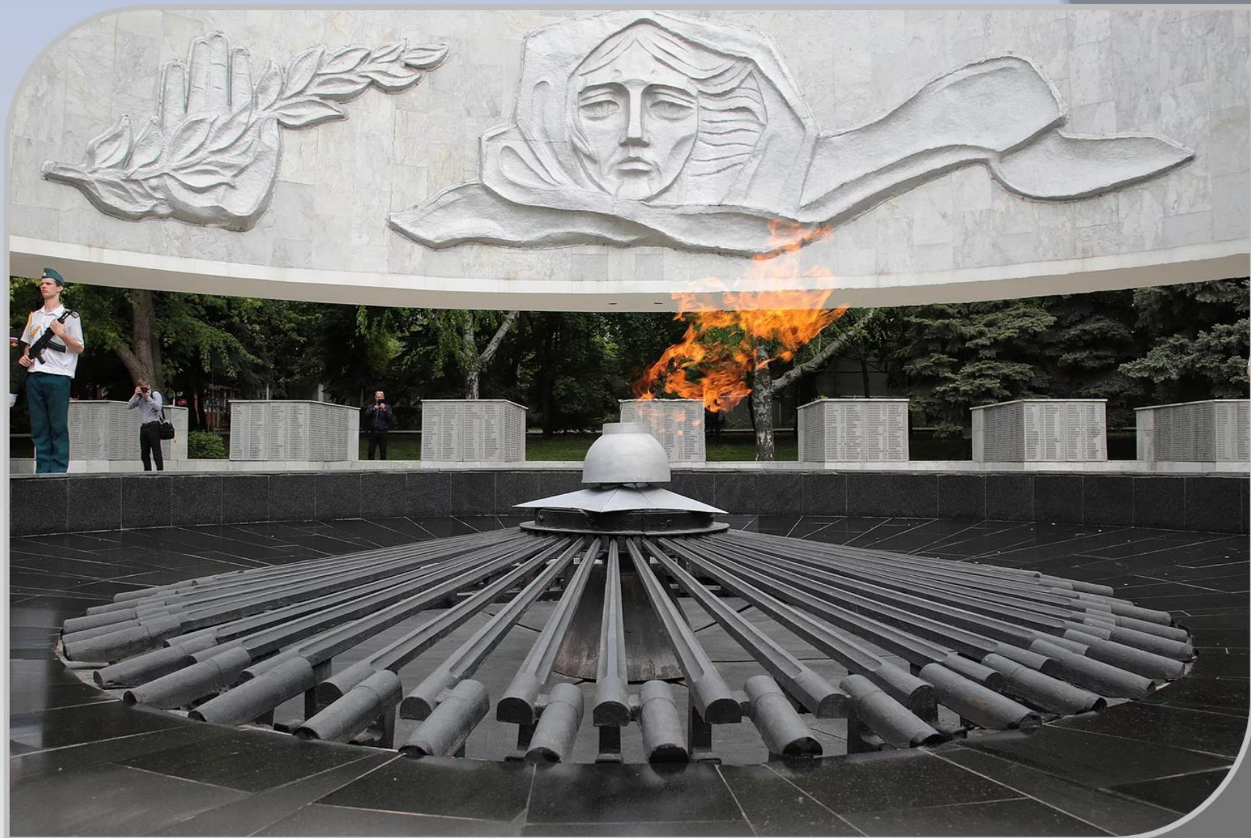
Мемориальный комплекс «Павшим воинам».