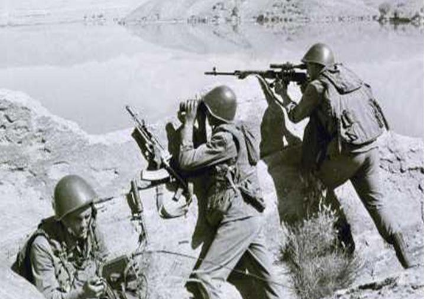
Наблюдение за противником