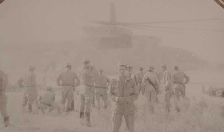
Вертолет Ми-26 готов к переброске ДШМГ из Маров в Пяндж (май 1988г.)