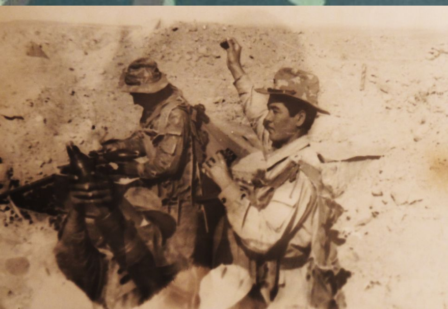
Огонь ведет минометный расчет Тахта-Базарского ДШМГ