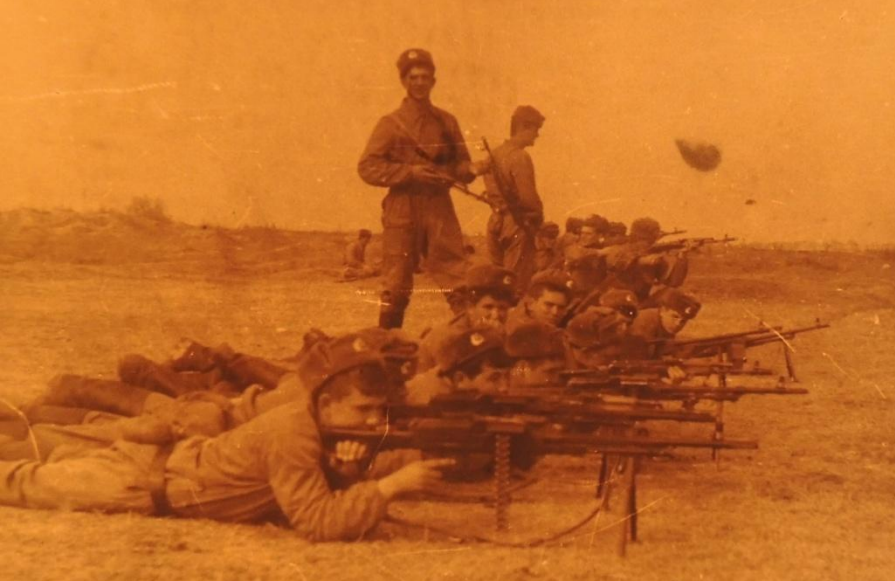
Ударная боевая группа 2 ДШПЗ (8 пулеметов ПК)