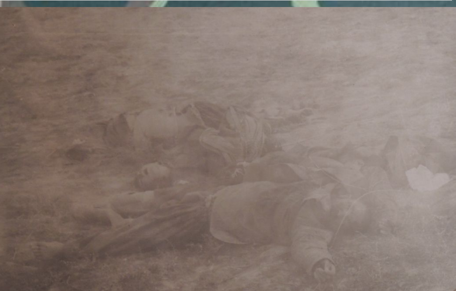
Убитые во время Кайсарской операции душманы