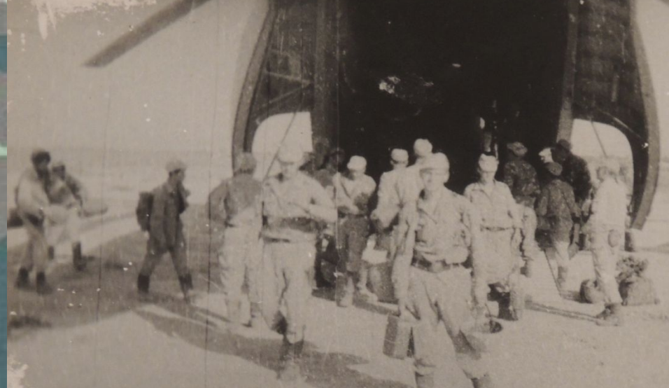
Пересадка 1 ДШПЗ в вертолет Ми-26, для вылета в Пянджа