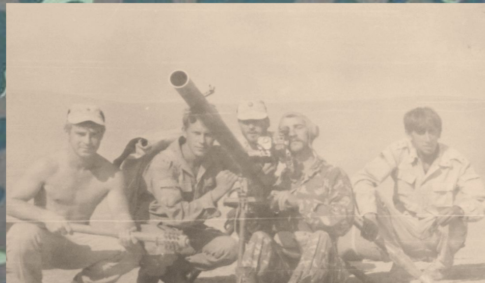
На позиции расчет станкового гранатомета СПГ-9