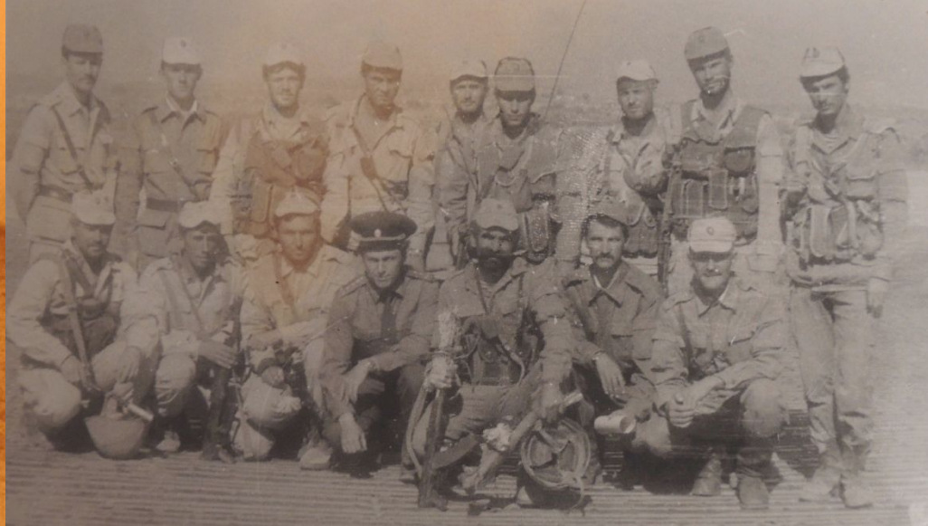
После возвращения с операции в Кайсаре ноябрь 1988г.