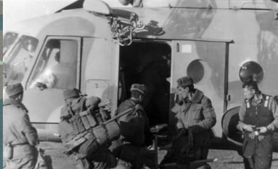
Погрузка в вертолет Ми-8 1-ой заставы Тахта-Базарского ДШМГ