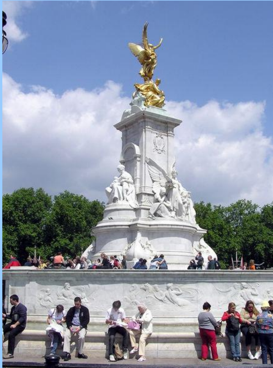
На площади возле дворца находится мемориал Королевы Виктории