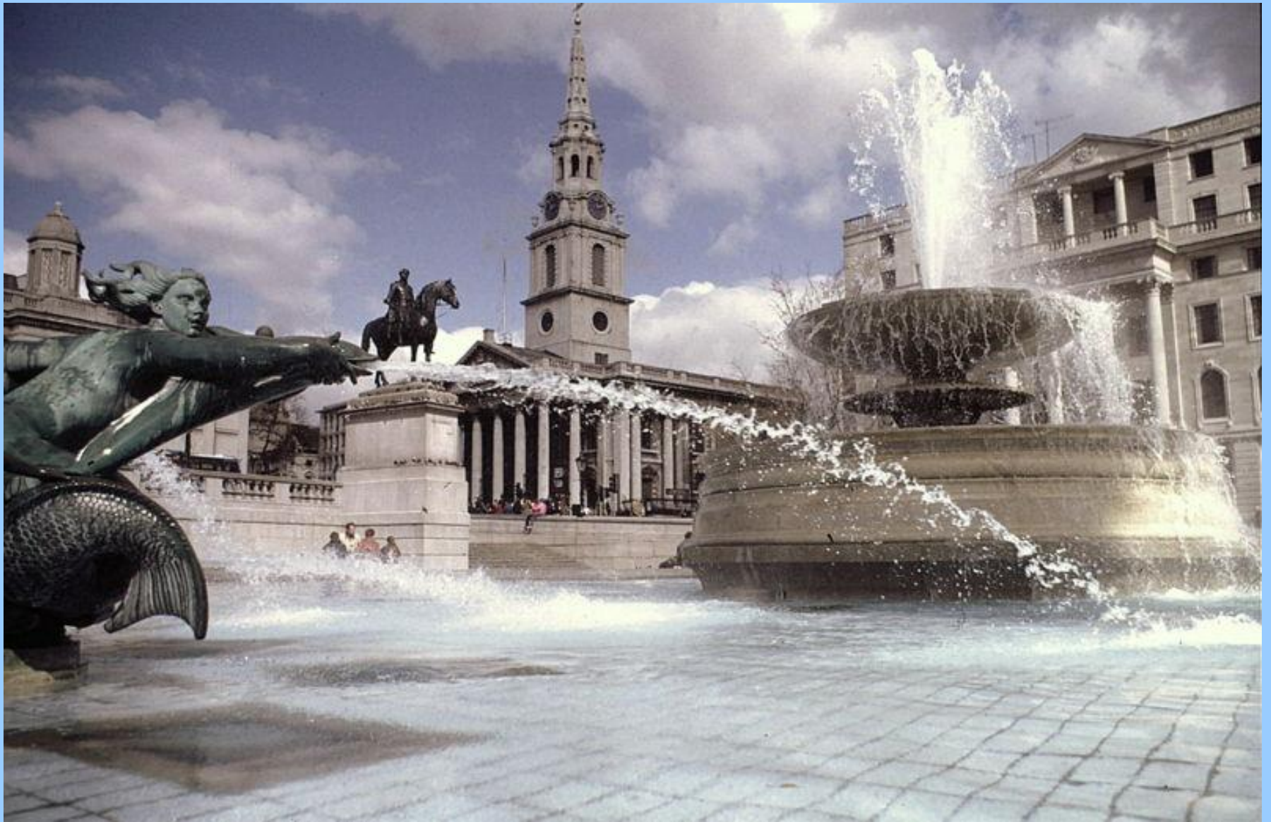
Достопримечательности Великобритании - Трафальгарская площадь