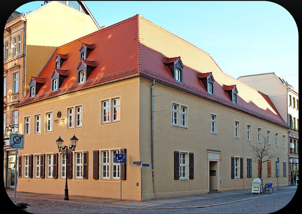
Дом Шумана в Цвикау

детстве он приобщился к профессиональной литературной работе, составляя статьи для энциклопедии, выходившей в издательстве его отца. Серьезно увлекался филологией, выполнял предыздательскую корректуру большого латинского словаря. А школьные литературные сочинения Шумана написаны на таком уровне, что были посмертно изданы в качестве приложения к собранию его зрелых журналистских трудов. В