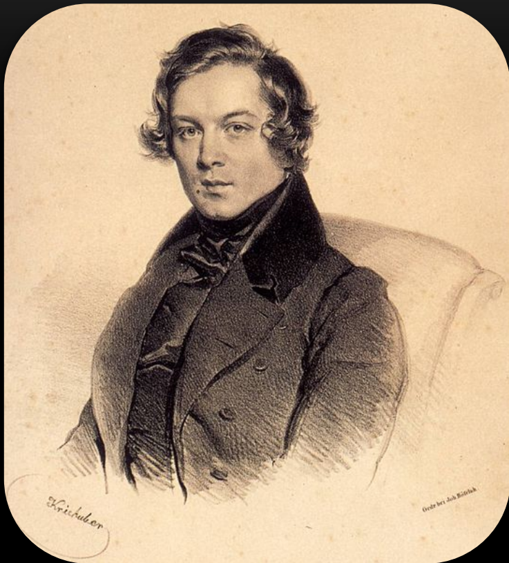
Роберт Шуман, Вена, 1839

Интеллектуал и эстет, в своей музыке Шуман больше, чем любой другой композитор, отразил глубоко личностную природу романтизма. Его ранняя музыка, интроспективная и зачастую причудливая, была попыткой порвать с традицией классических форм и структур, по его мнению, слишком ограниченных. Во многом родственное поэзии Г. Гейне, творчество Шумана бросало вызов духовной убогости Германии 1820-х — 1840-х годов, звало в мир высокой человечности. Наследник Ф.