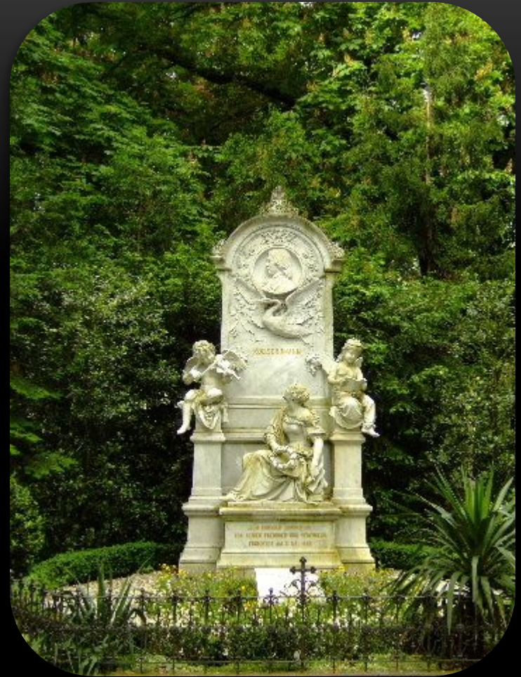
Могилы Роберта и Клары Шуман