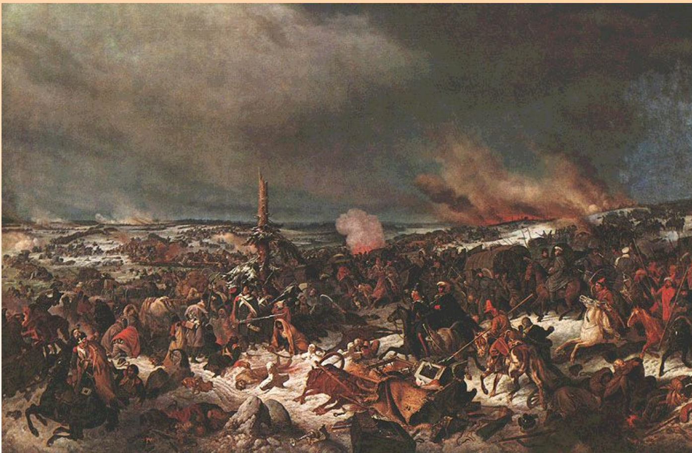
Переправа через Березину Художник Петер Гесс