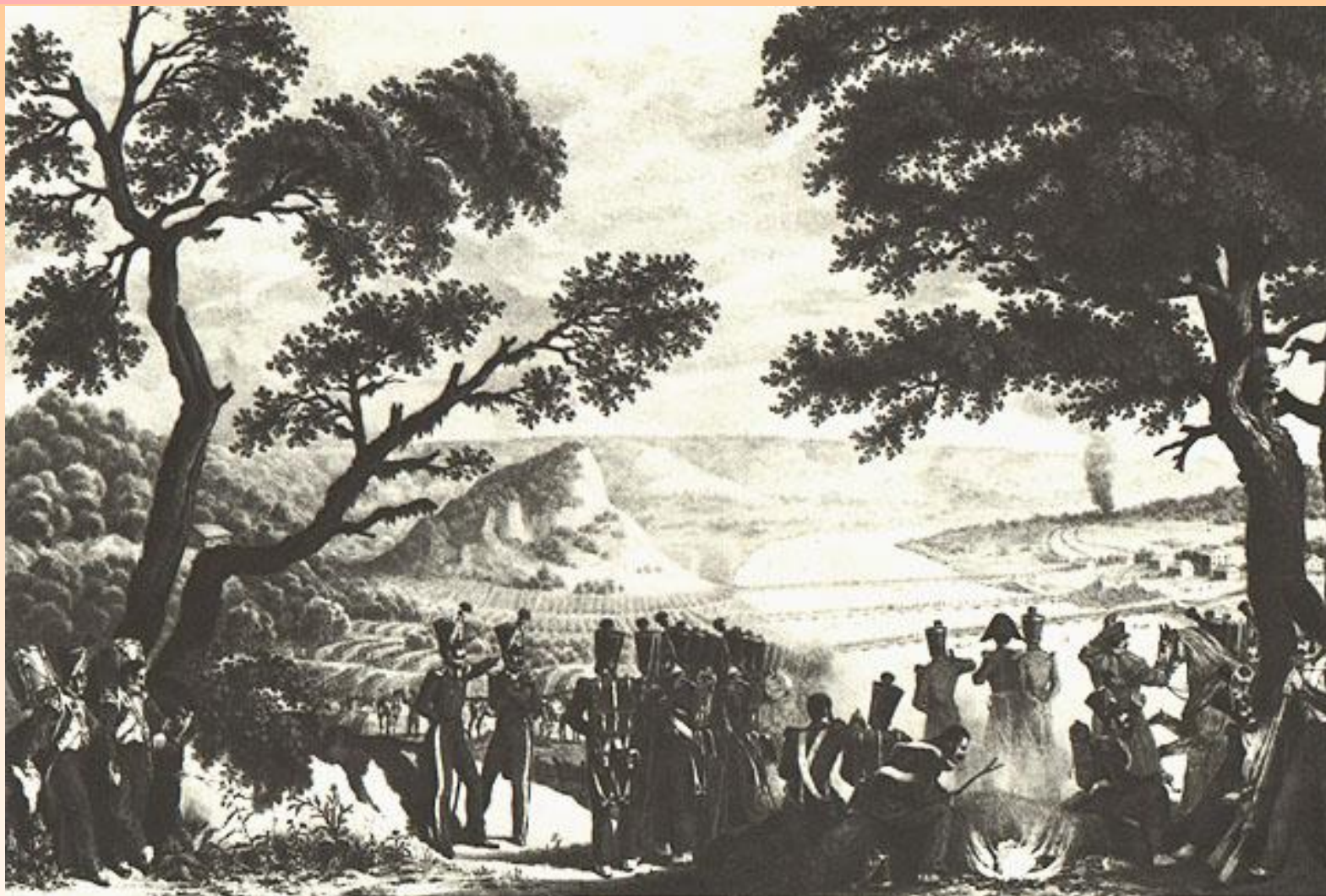
На берегу Немана 13 (25) июня 1812г. Худ. Х.В. Фабер дю Фор