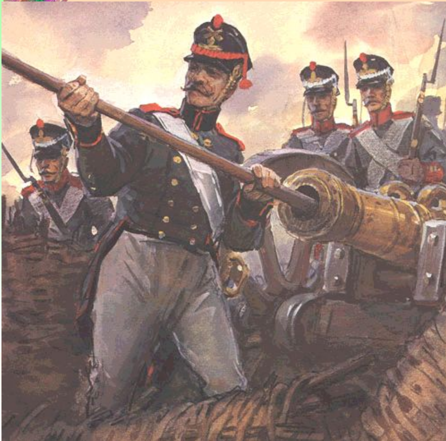
Артиллеристы на Бородинском поле Худ. В.Шевченко 1970-е г.