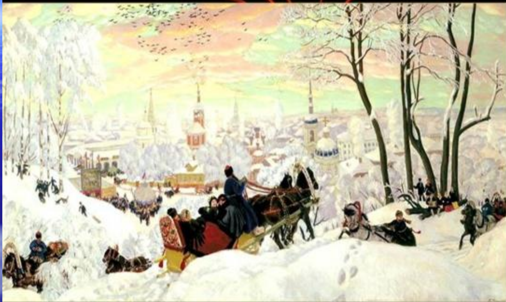
Б. М. Кустодиев. «Масленица» 1903