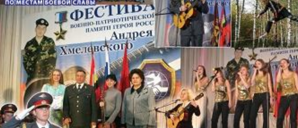
ФЕСТИВАЛЬ-КОНКУРС ВОЕННО-ПАТРИОТИЧЕСКОЙ ПЕСНИ ПАМЯТИ ГЕРОЯ РОССИИ АНДРЕЯ ХМЕЛЕВСКОГО