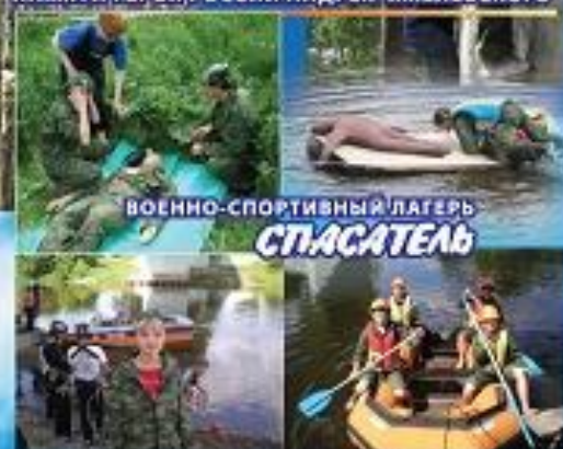
ВОЕННО-СПОРТИВНЫЙ ЛАГЕРЬ СПАСАТЕЛЬ