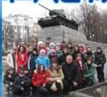
ПОХОДЫ И ЭКСПЕРСИОННЫЕ ПОЕЗДКИ ПО МЕСТАМ БОЕВОЙ СЛАВЫ