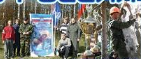
ЛИЧНО-КОМАНДНОЕ ПЕРВЕНСТВО ПО ТУРИЗМУ ПАМЯТИ ГЕРОЯ РОССИИ АНДРЕЯ ХМЕЛЕВСКОГО