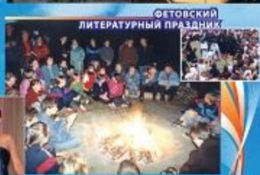
ФЕТОВСКИЙ ЛИТЕРАТУРНЫЙ ПРАЗДНИК