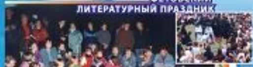
ФЕТОВСКИЙ ЛИТЕРАТУРНЫЙ ПРАЗДНИК