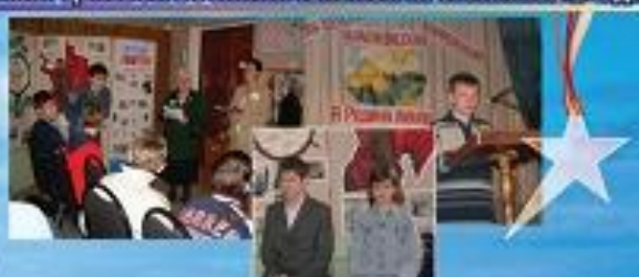
ДЕТСКАЯ КРАЕВЕДЧЕСКАЯ КОНФЕРЕНЦИЯ «Я РОДИНУ ЛЮБЛЮ» В РАМКАХ ЦЕЛЕВОЙ ВОСПИТАТЕЛЬНОЙ ПРОГРАММЫ «ЗРУДИТ»