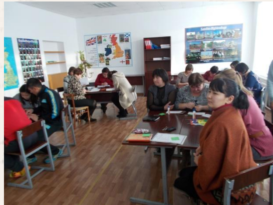
Участие в педсоветах