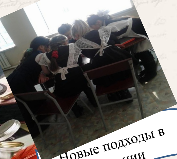
Новые подходы в обучении