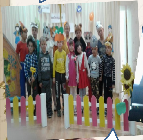
Участие в театральном представлении