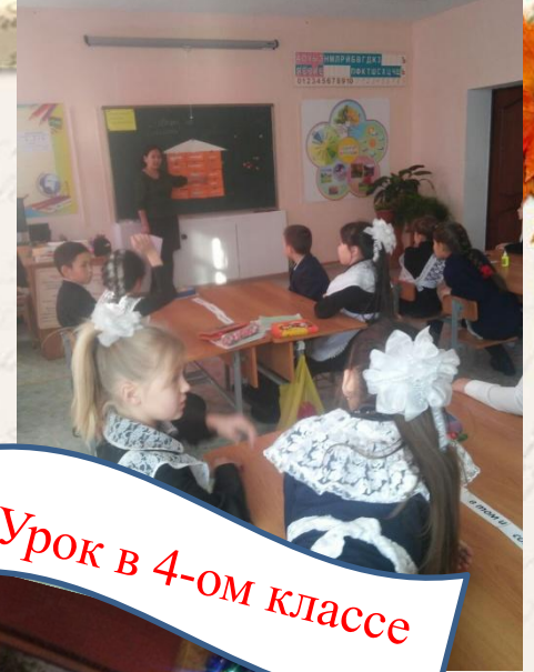
Урок в 4-ом классе