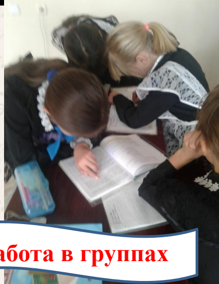
Работа в группах