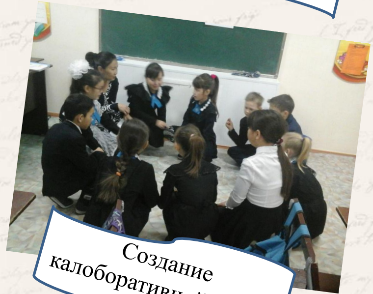
Создание калоборативной среды