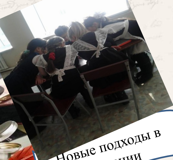
Новые подходы в обучении