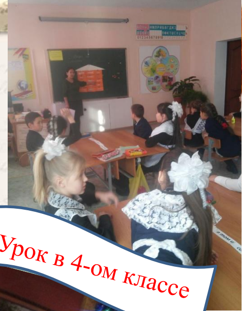
Урок в 4-ом классе