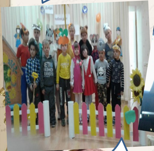
Участие в театральном представлении