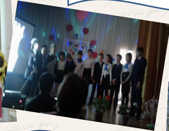
Участие в конкурсе песен