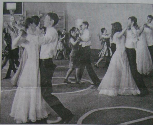
Старшеклассники Поимской школы кружатся в вальсе.