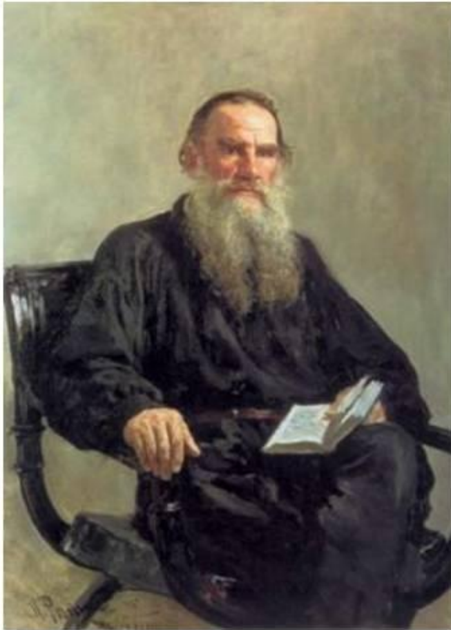
И.Е.Репин. Портрет Льва Толстого, 1887

Л. Н. Толстой, потомственный русский аристократ, потомок старинных дворянских родов по отцовской и по материнской линиям, принадлежал к высшей аристократической верхушке русского дворянства