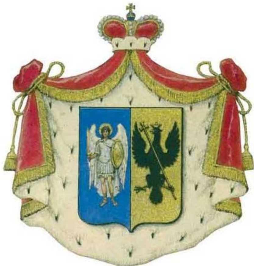
Герб князей Волконских. 1890-е годы

По материнской линии Толстой принадлежал к роду князей Болконских, связанных родством с князьями Трубецкими, Голицыными, Одоевскими, Лыковыми и другими знатными семьями. По матери Толстой был родственником А. С. Пушкина.