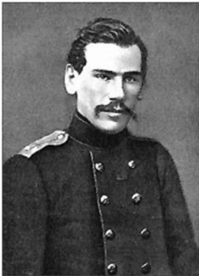
Лев Толстой в 1856 г.

Осенью 1856 г. Л. Н. Толстой вышел в отставку и вскоре отправился в полугодичное заграничное путешествие, посетив Францию, Швейцарию, Италию и Германию.