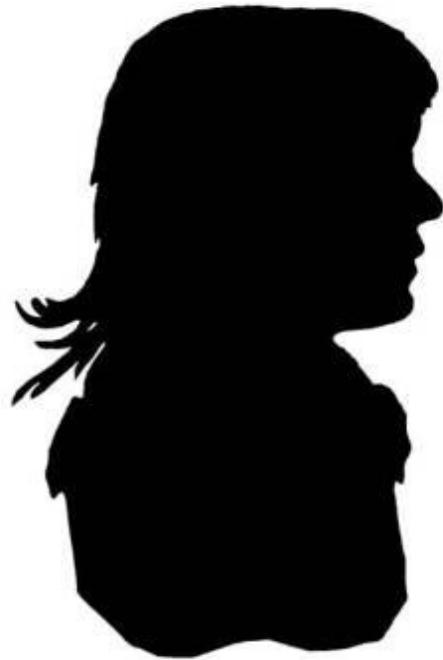
Силуэт няжны Марии Николаевны Волконской. 1800-е годы. Работа неизвестного художника. Государственный музей Л.Н.Толстого

Мария Николаевна Толстая (урождѣнная Волконская), мать писателя, была добрым и отзывчивым человеком, умной и образованной женщиной: