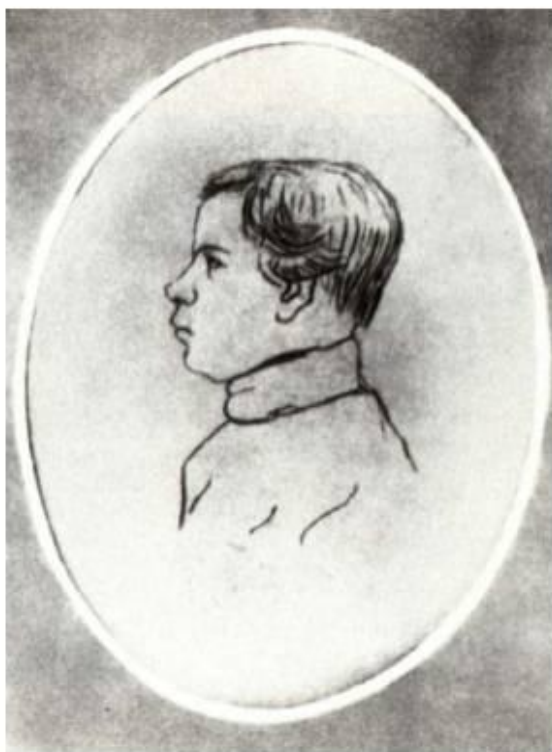
Толстой Л. Н. (юношей, в профиль)

Когда Толстому шел девятый год, отец впервые повез его в Москву. Первый период московской жизни юного Толстого продолжался менее четырех лет. Но вскоре отец умер. В 1840 году с сестрой и тремя братьями юный Толстой переезжает в Казань. Здесь жила одна из отцовских сестер, ставшая их опекуншей.