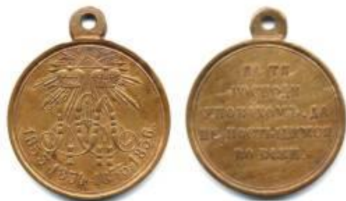
Медаль в память войны 1853 – 1856 г.

Вскоре Толстой решил поехать на Кавказ, где его старший брат, Николай Николаевич, офицер-артиллерист, служил в действующей армии. Поступив в армию юнкером, позже он сдал экзамен на младший офицерский чин. Когда началась Крымская война, Толстой перевелся с Кавказа в Дунайскую армию, действовавшую против турок, а затем в Севастополь, осажденный объединенными силами Англии, Франции и Турции.