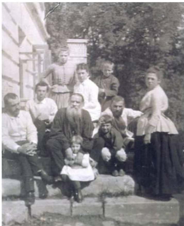
Л. Н. Толстой с женой и детьми. 1887 год