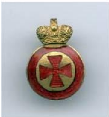
Орден св. Анны IV степени