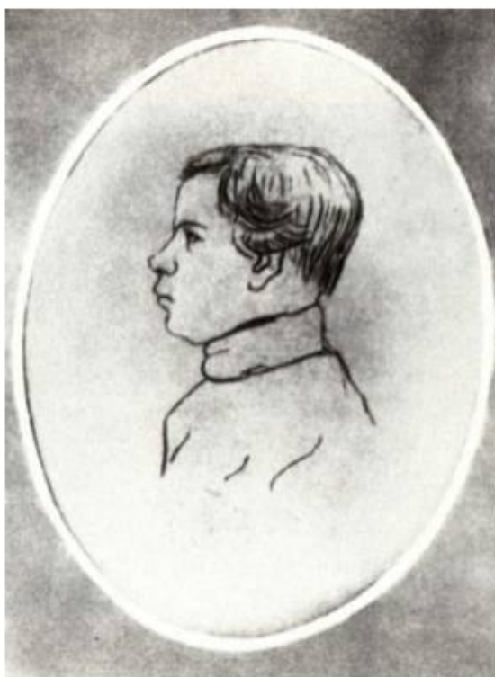
Толстой Л. Н. (юношей, в профиль)

Когда Толстому шел девятый год, отец впервые повез его в Москву. Первый период московской жизни юного Толстого продолжался менее четырех лет. Но вскоре отец умер. В 1840 году с сестрой и тремя братьями юный Толстой переезжает в Казань. Здесь жила одна из отцовских сестер, ставшая их опекуной.