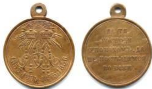
Медаль в память войны 1853 – 1856 г.

Вскоре Толстой решил поехать на Кавказ, где его старший брат, Николай Николаевич, офицер-артиллерист, служил в действующей армии. Поступив в армию юнкером, позже он сдал экзамен на младший офицерский чин. Когда началась Крымская война, Толстой перевелся с Кавказа в Дунайскую армию, действовавшую против турок, а затем в Севастополь, осажденный объединенными силами Англии, Франции и Турции.