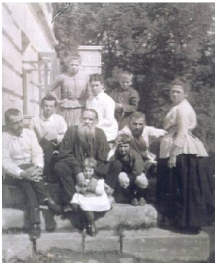
Л. Н. Толстой с женой и детьми. 1887 год