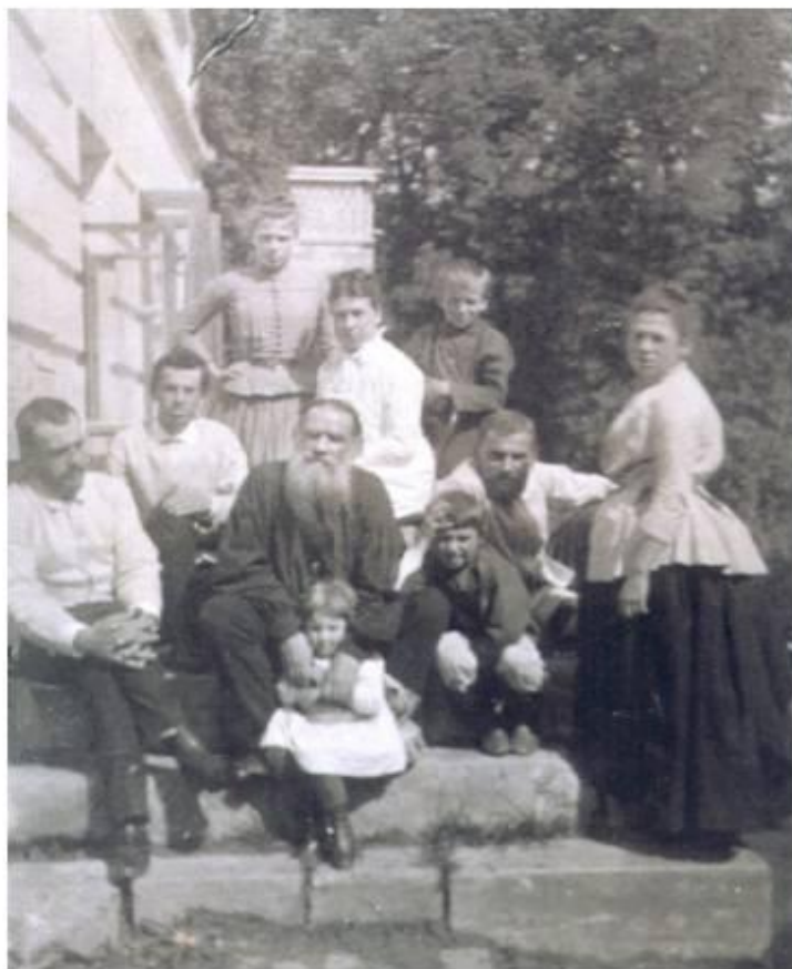
Л. Н. Толстой с женой и детьми. 1887 год

«Нельзя передать с достаточной полнотой того веселого и привлекательного настроения, которое постоянно царило в Ясной Поляне (1862-1878гг.). Источником его всегда был Лев Николаевич. В разговоре об отвлеченных вопросах, о воспитании детей, о внешних событиях его суждение было самое интересное. В игре в крокет, в прогулке он оживлял всех своим юмором и участием, искренне интересуясь игрой и прогулкой. Не было такой простой мысли и самого простого действия, которым Лев Николаевич не умел придать интереса и вызвать к ним хорошего и веселого отношения в окружающих...», - вспоминала Берс.