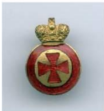
Орден св. Анны IV степени