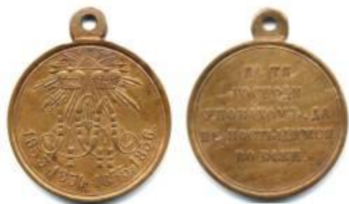
Медаль в память войны 1853 – 1856 г.

Вскоре Толстой решил поехать на Кавказ, где его старший брат, Николай Николаевич, офицер-артиллерист, служил в действующей армии. Поступив в армию юнкером, позже он сдал экзамен на младший офицерский чин. Когда началась Крымская война, Толстой перевелся с Кавказа в Дунайскую армию, действовавшую против турок, а затем в Севастополь, осажденный объединенными силами Англии, Франции и Турции.