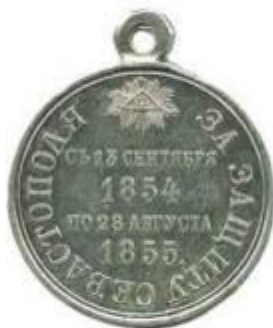
Медаль за защиту Севастополя