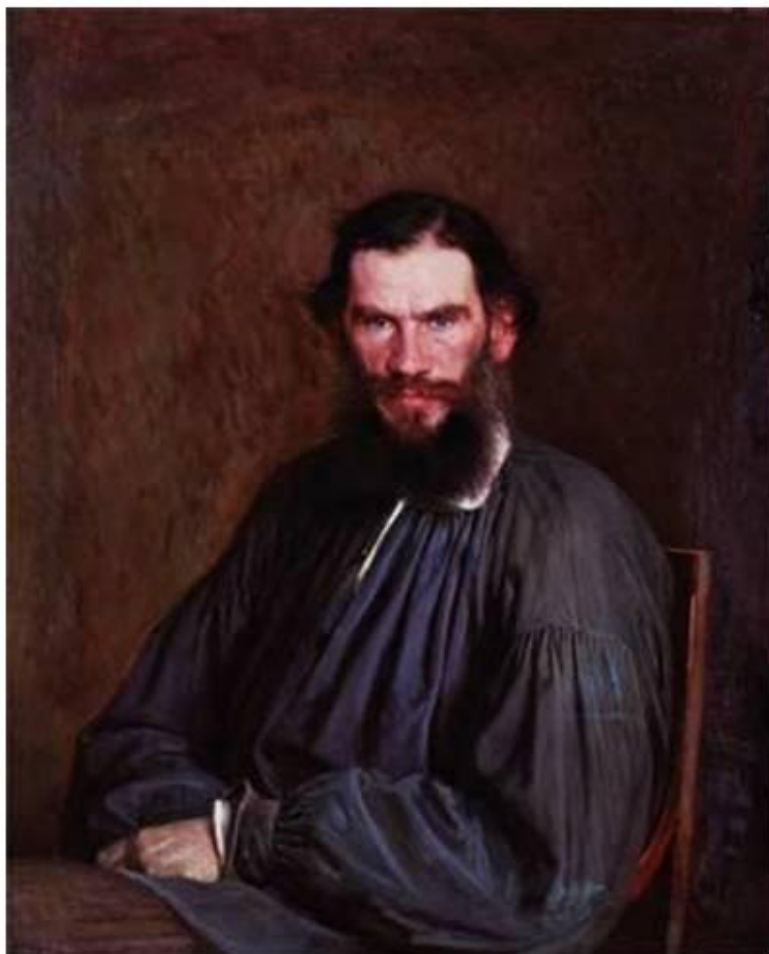
Лев Николаевич Толстой Портрет И.Н. Крамского. 1873 г.

Толстой Лев Николаевич (1828-1910), граф, русский писатель, член-корреспондент (1873), почетный академик (1900) Петербургской АН.