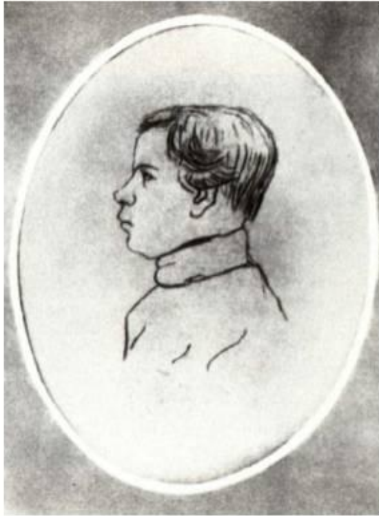
Толстой Л. Н. (юношей, в профиль)

Когда Толстому шел девятый год, отец впервые повез его в Москву. Первый период московской жизни юного Толстого продолжался менее четырех лет. Но вскоре отец умер. В 1840 году с сестрой и тремя братьями юный Толстой переезжает в Казань. Здесь жила одна из отцовских сестер, ставшая их опекуншей.