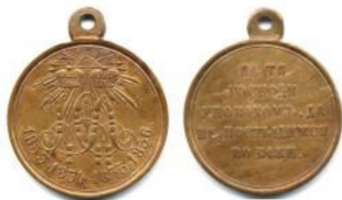
Медаль в память войны 1853 – 1856 г.