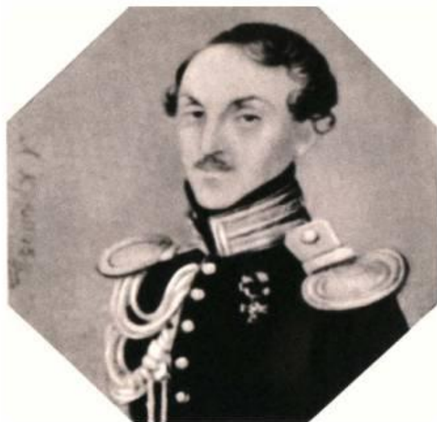
Николай Ильич Толстой, отец Льва Николаевича

Отец писателя – граф Николай Ильич Толстой – в семнадцатилетнем возрасте добровольно поступил на военную службу. Он участвовал в Отечественной войне 1812 года, попал в плен к французам и был освобожден русскими войсками, вступившими в Париж после разгрома армии Наполеона.