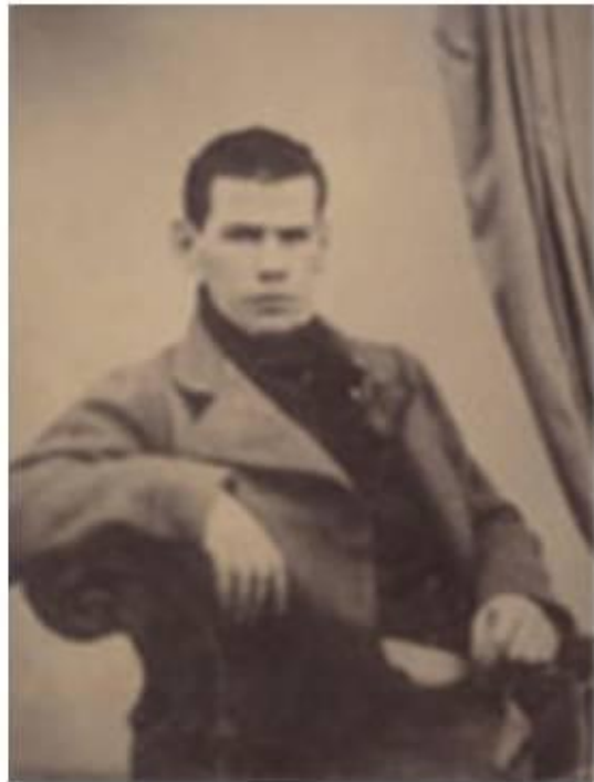
Л. Н. Толстой. 1849 г.

Но после трех лет учебы Толстой решил перейти на самообразование - учиться самостоятельно по собственному плану.