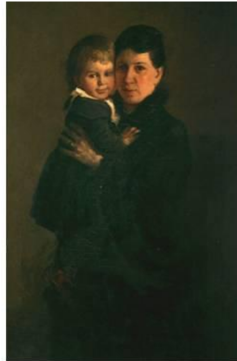
Ге. Портрет Софьи Андреевны Толстой с дочерью Александрой (Софья Андреевна Толстая, жена Льва Николаевича Толстого, 1844-1919; Александра Львовна Толстая, дочь Льва Николаевича Толстого, 1884-1979) (1886, Тульская область, Музей-усадьба Льва Толстого «Ясная Поляна»)