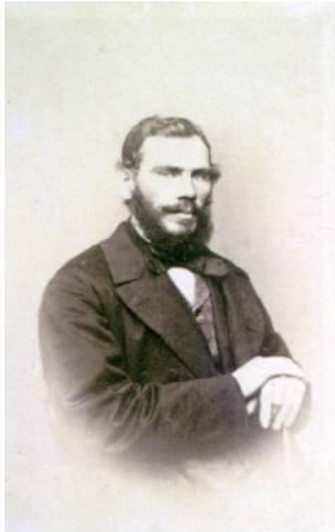
Л. Н. Толстой, 1862 г.

В 1862 г. он женился на дочери московского врача Софье Андреевне Берс.