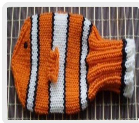
Рисунок рыбы означает символ плодородия