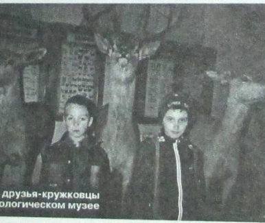
Мои друзья-кружковцы в Зоологическом музее

- теракты - вот опасность для детей. Неужели террористы сами не родители? Где их родительская забота, материнская любовь, отцовское беспокойство? Это же люди.