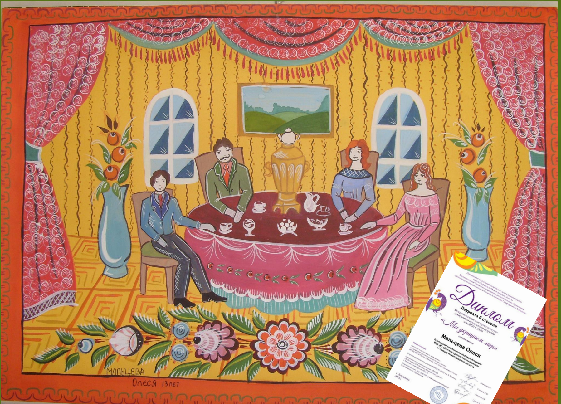
МАЛЬЦЕВА Олеся 13 лет