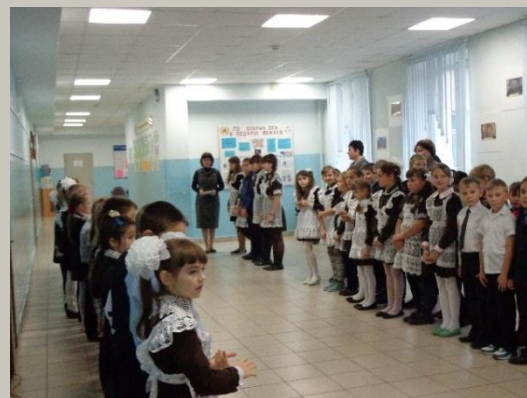
«Посвящение в орлята»