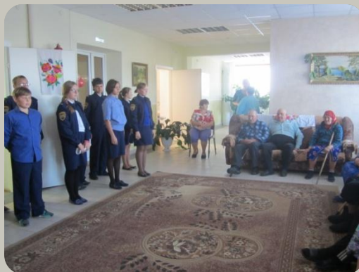
Акция «Радость людям»