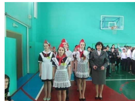
Смотр строя и песни