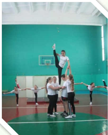
Минута спортивной славы