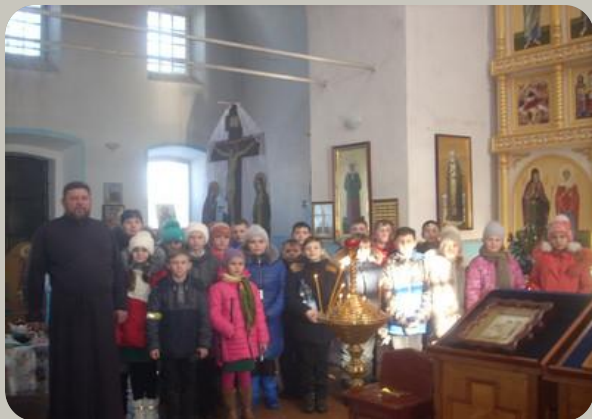
Посещение Богородицкого храма