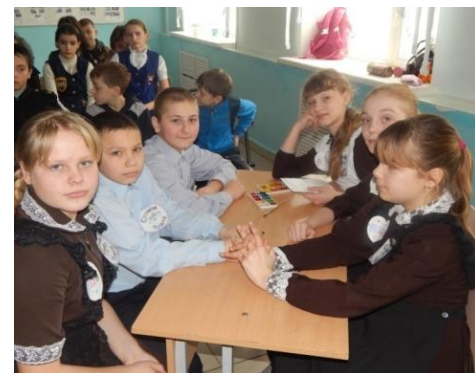
Конкурс «Грамотные потребители»