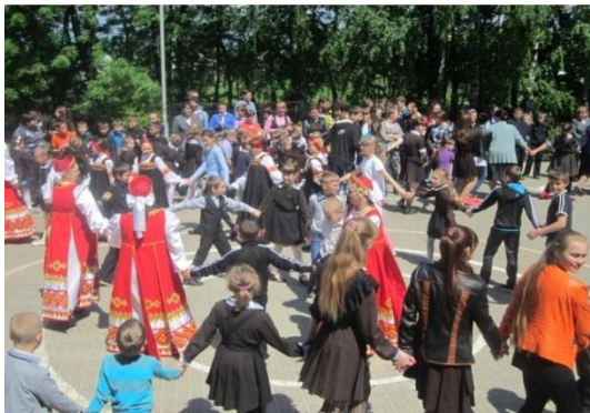
День славянской письменности