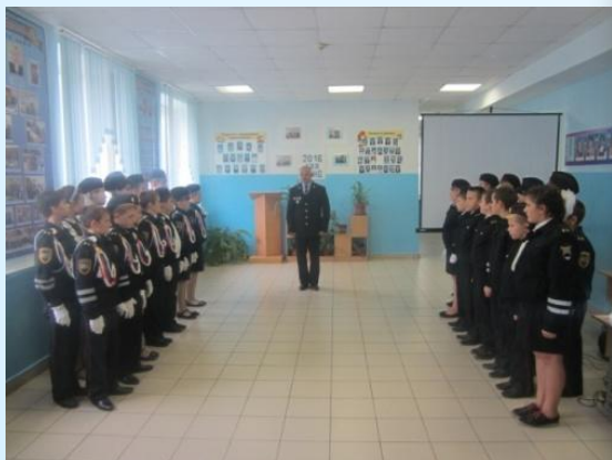
«Кадеты. Нам один год»