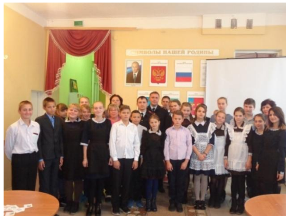
Неделя Европейской демократии