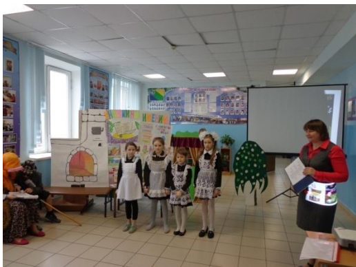
Неделя детской книги