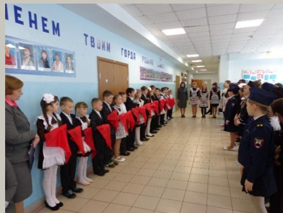
Прием в пионеры