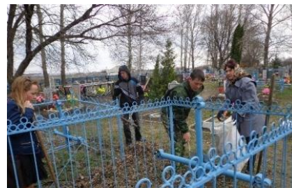
Благоустройство захоронений ветеранов Великой Отечественной войны