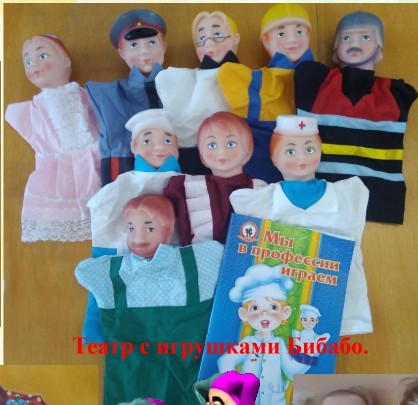
Театр с игрушками Бибабо.