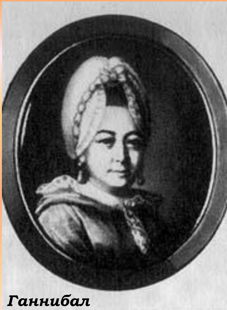
Ганнибал Мария Алексеевна

Любовь к родному языку маленькому Пушкину привила бабушка, Мария Алексеевна Ганнибал, превосходно говорившая и писавшая по-русски.