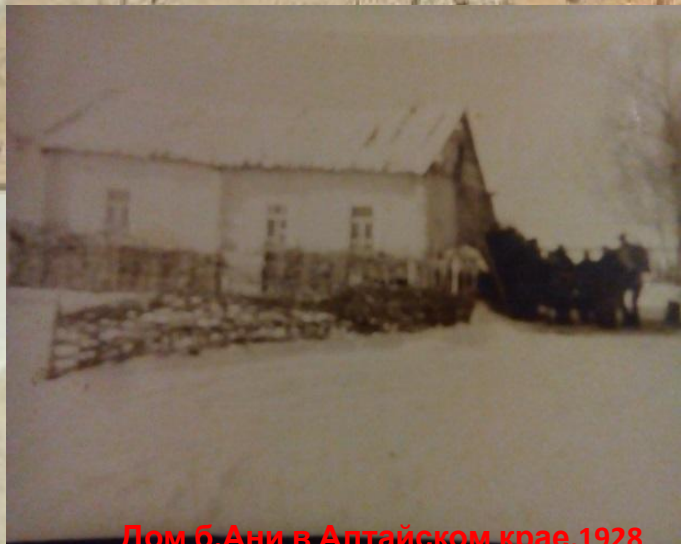
Дом б.Ани в Алтайском крае, 1928 год