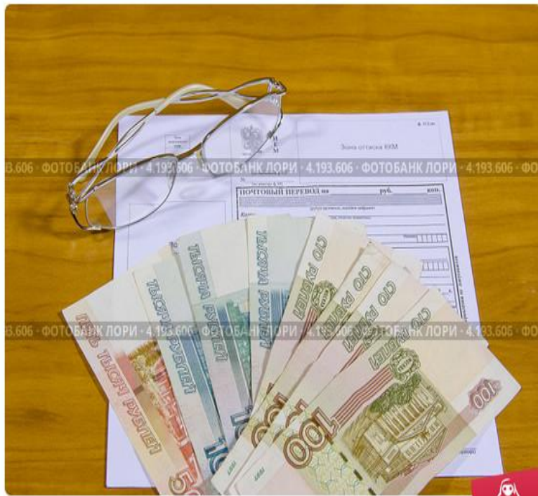
Бланк почтового перевода, деньги и очки