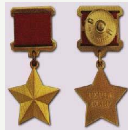
Медаль "Золотая Звезда" (первоначально называлась Герой Советского Союза") вручалась с 1939 года. Автор - худ. И.И. Дубасов.

Героям Советского Союза вручались высшая награда СССР - орден Ленина и Грамота ЦИК СССР (с декабря 1937 - Президиума Верховного Совета СССР). С 01.08.39г. Указом Президиума Верховного Совета СССР был учрежден дополнительный знак отличия - медаль "Золотая Звезда". В ознаменование подвигов дважды Героя Советского Союза устанавливается бронзовый бюст на родине награжденного