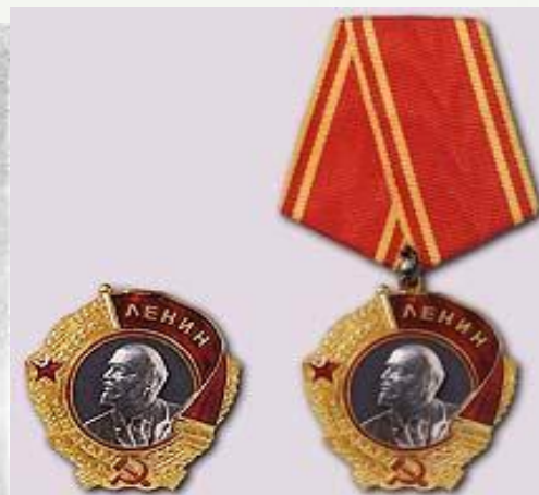
Орден Ленина вручался Герою Советского Союза с 1936 года (на колодке - с 1943 года)