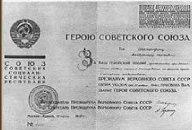
Грамота Герою Советского Союза вручалась с 1934 года.