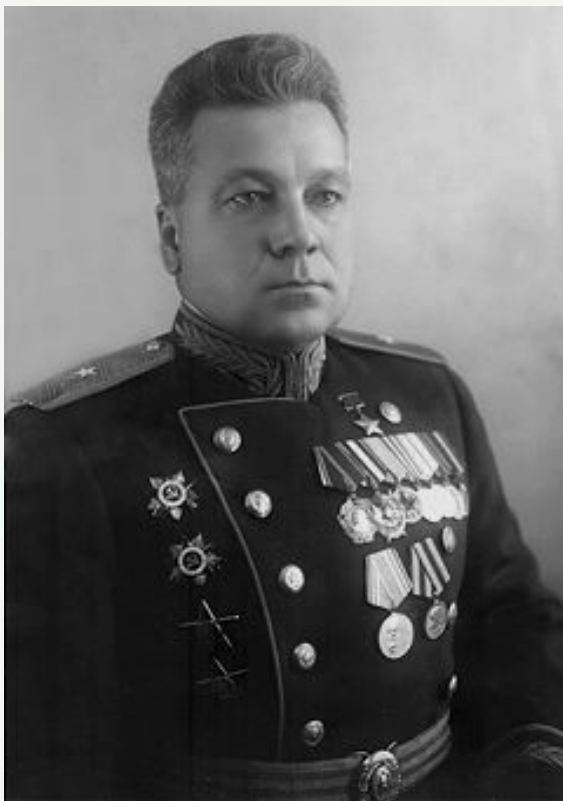
Лётчик - Ляпидевский А. В. (20.04.1934).