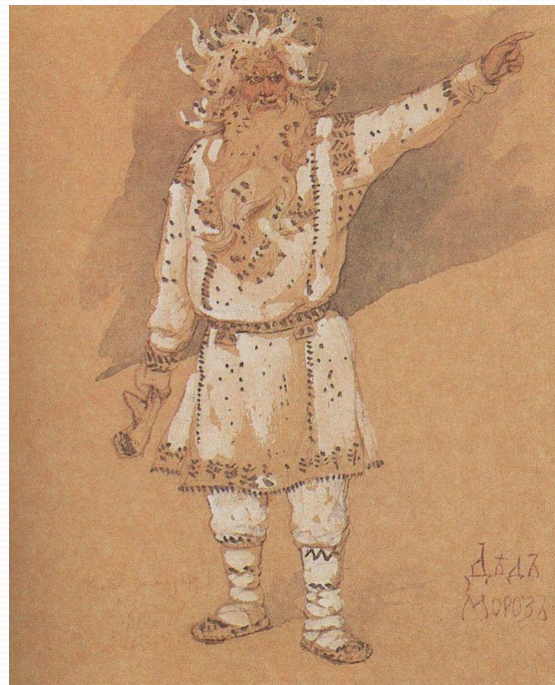
«Дед Мороз» худ. Виктор Михайлович Васнецов