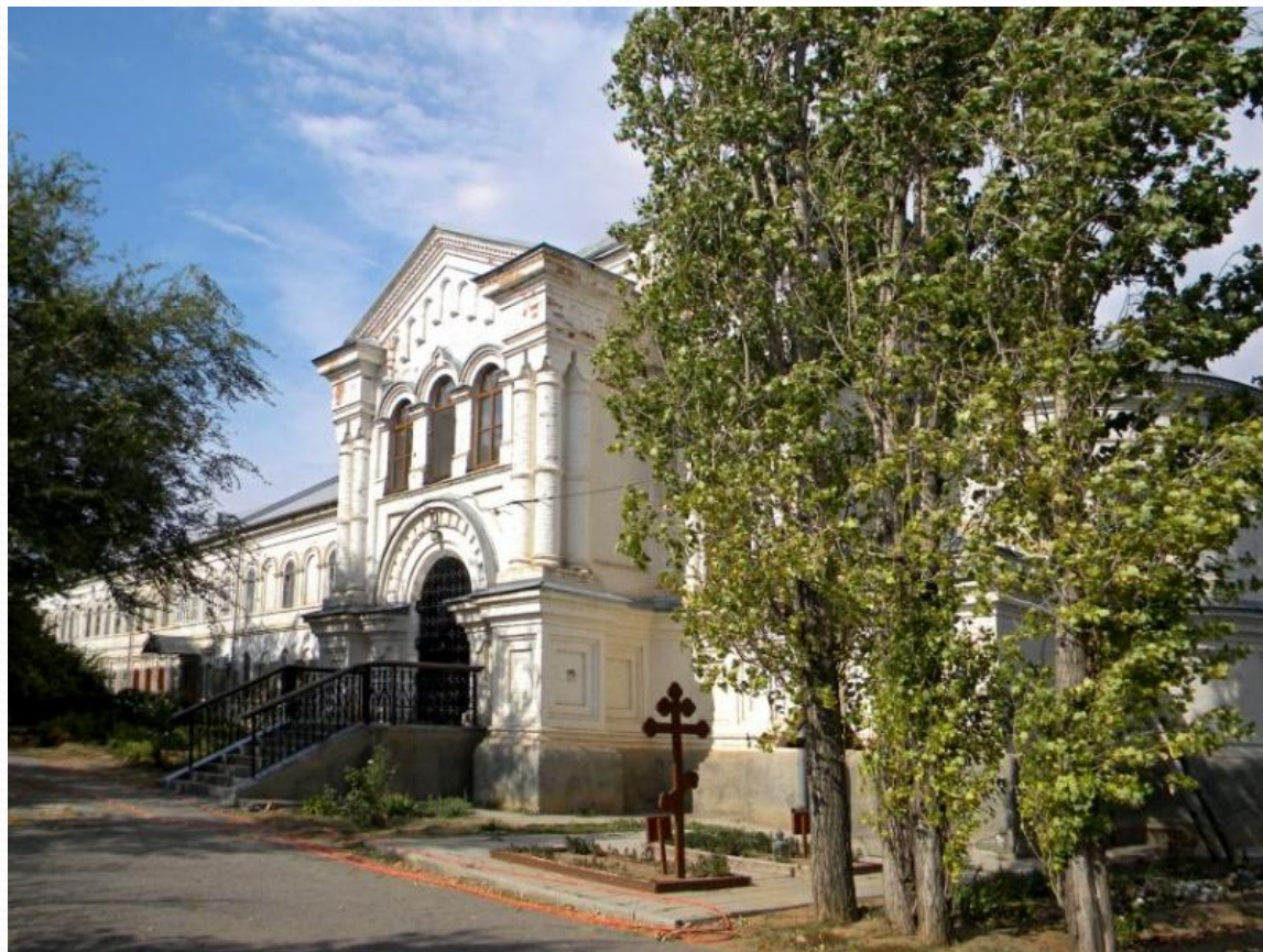
Дубовский Вознесенский монастырь. Волгоградская область.