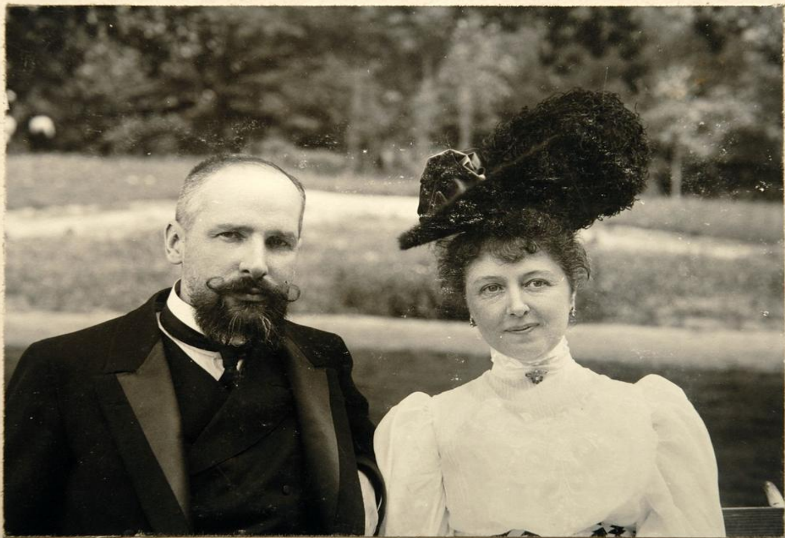
П. А. Столыпинъ — Министръ Внутреннихъ Дѣлъ, въ 1906 г., съ супругой.