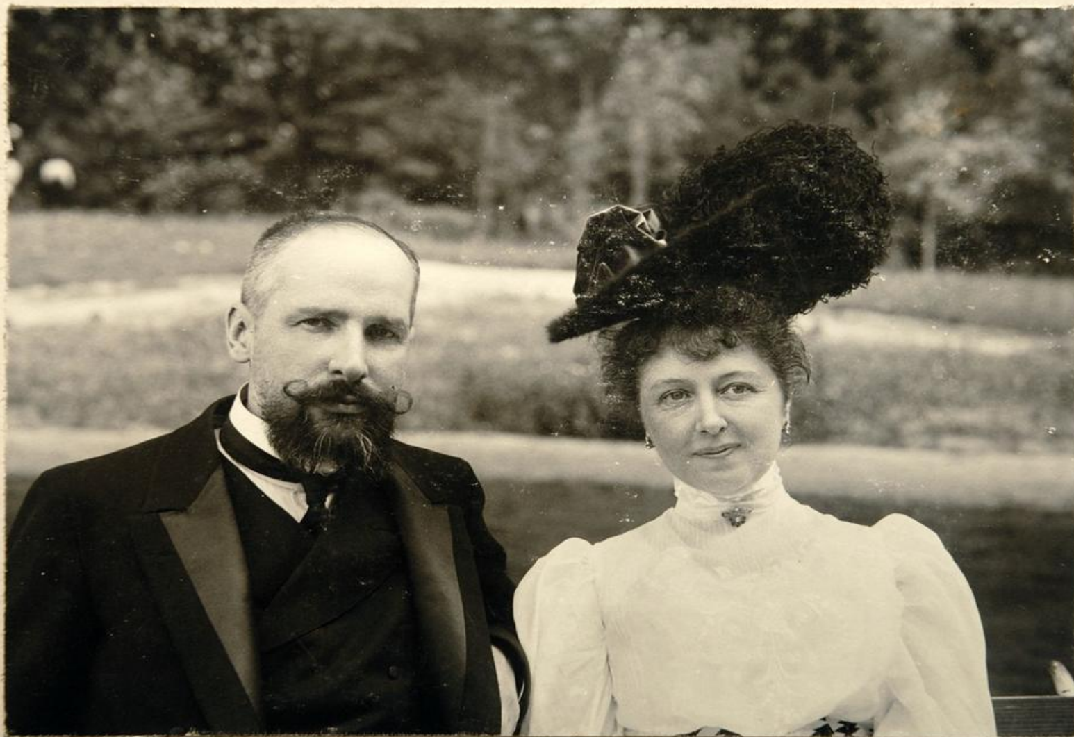
П. А. Столыпинъ — Министръ Внутреннихъ Дѣлъ, въ 1906 г., съ супругой.