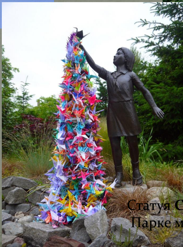
Статуя Садако Сасаки в Парке мира в Сиэтле