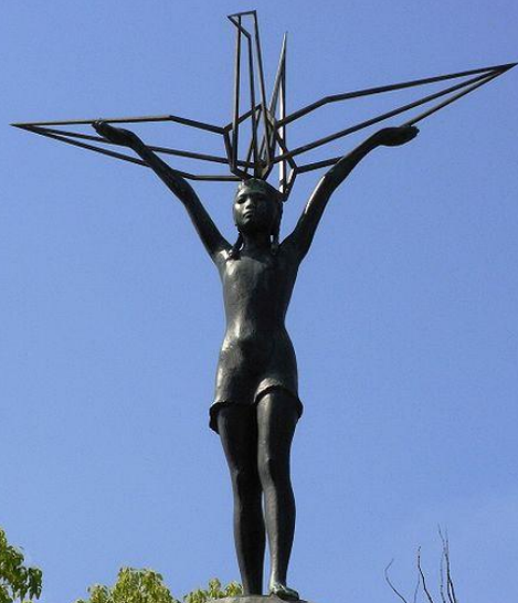
Памятник и статуи Садако Сасаки в Хиросиме