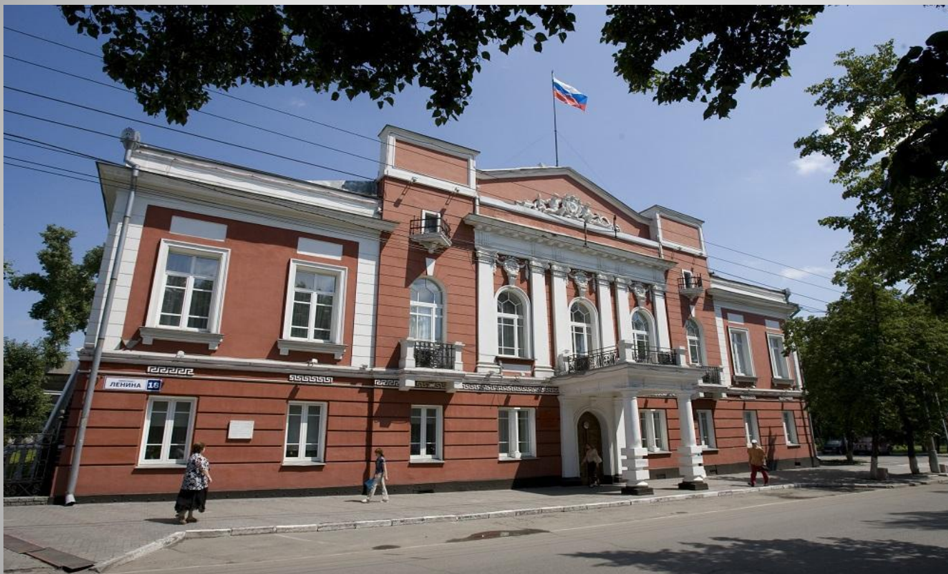
Городская дума Барнаула