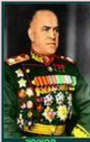
ЖУКОВ Георгий Константинович великий русский полководец

"Надо отдать должное руководству страны, которое воздвигло такого гениального полководца, как Жуков. В прежние времена Господь воздвигал для России Суворова, Кутузова. В наше время Георгий Жуков — это была милость Божия. Мы обязаны ему спасением".