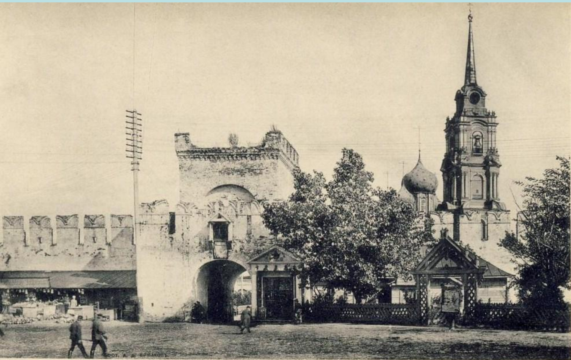
Гор. Тула. Западныя Кремлевскія ворота и Менделѣевская площадь.