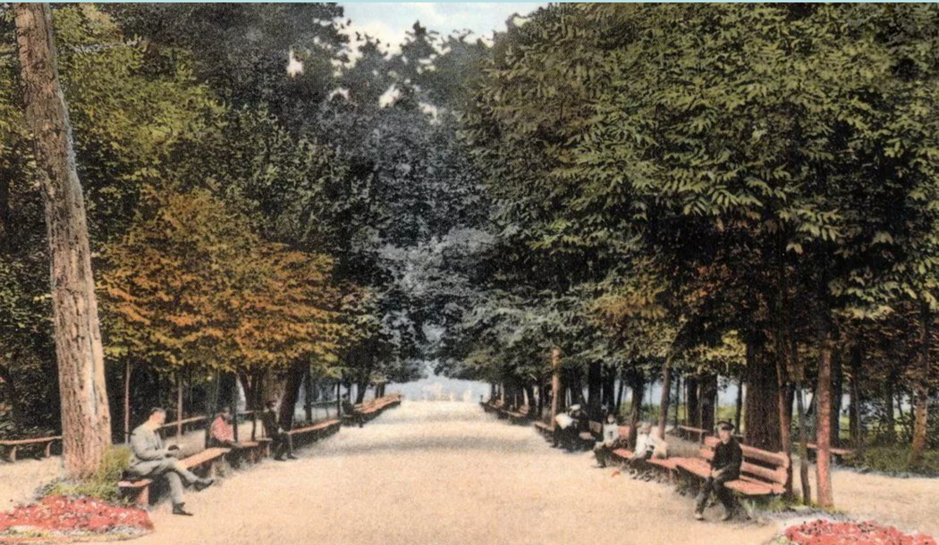
г. ТУЛА. Аллея кремлевского сада