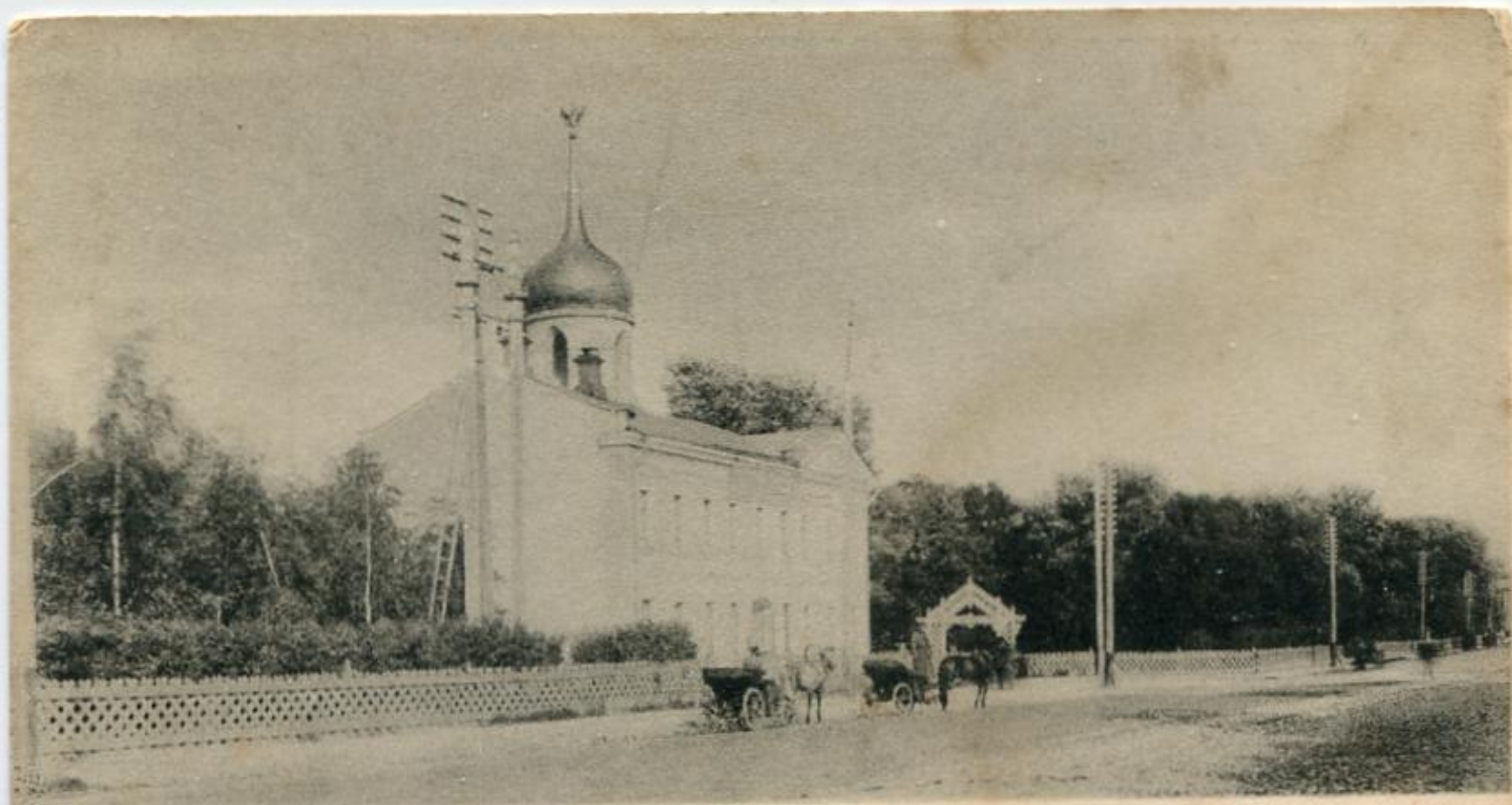
г. Тула. Кремлевскій садъ.