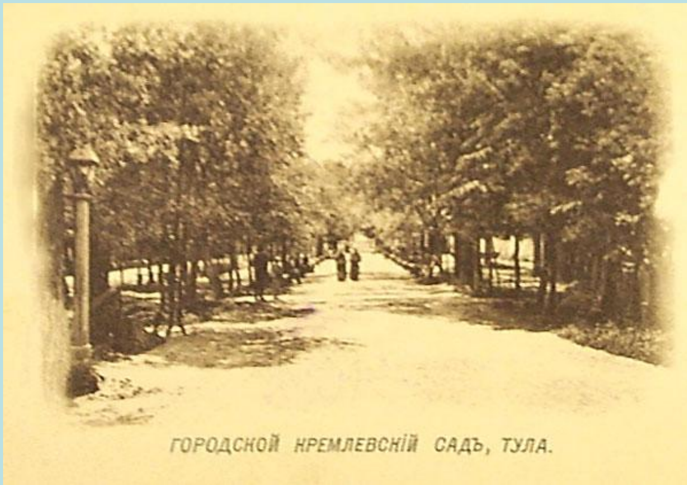
ГОРОДСКОЙ КРЕМЛЕВСКОЙ САДЪ, ТУЛА.