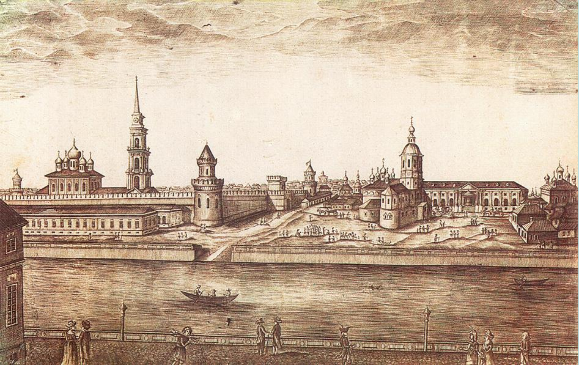
Гравюра 1807 г.