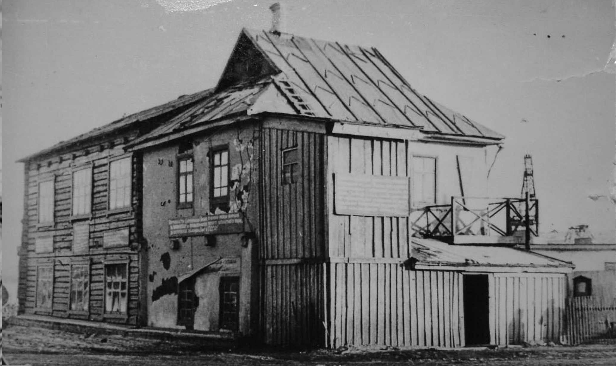
Здание управления I го района и главной ветеринарной по/ста, 1953г.