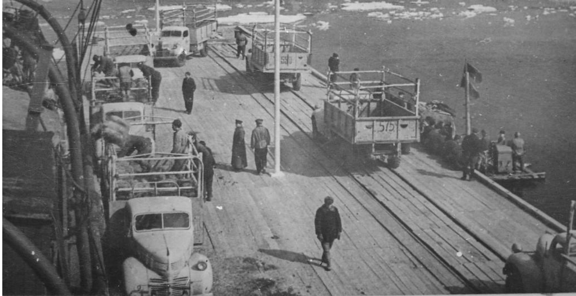
Пирс № 1 вступил в эксплуатацию. Кольцевое движение автомашин при разгрузке парохода. 1945.