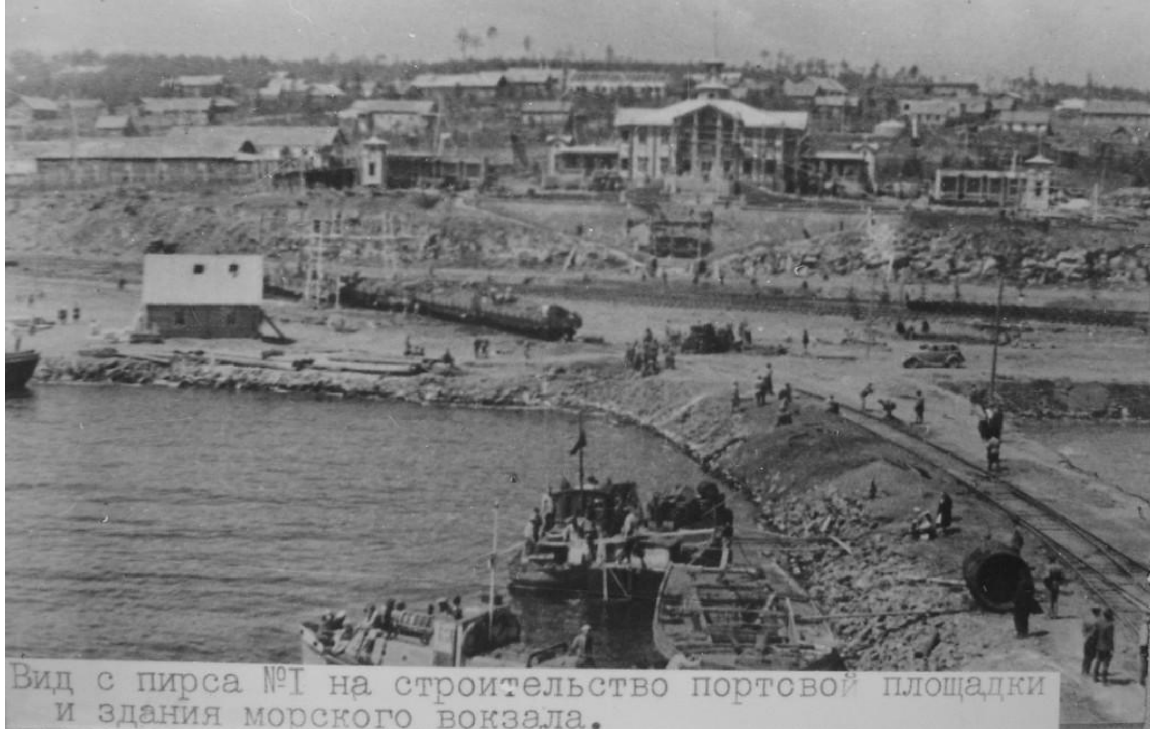
Вид с пирса №1 на строительство портсвой площадки и здания морского вокзала.