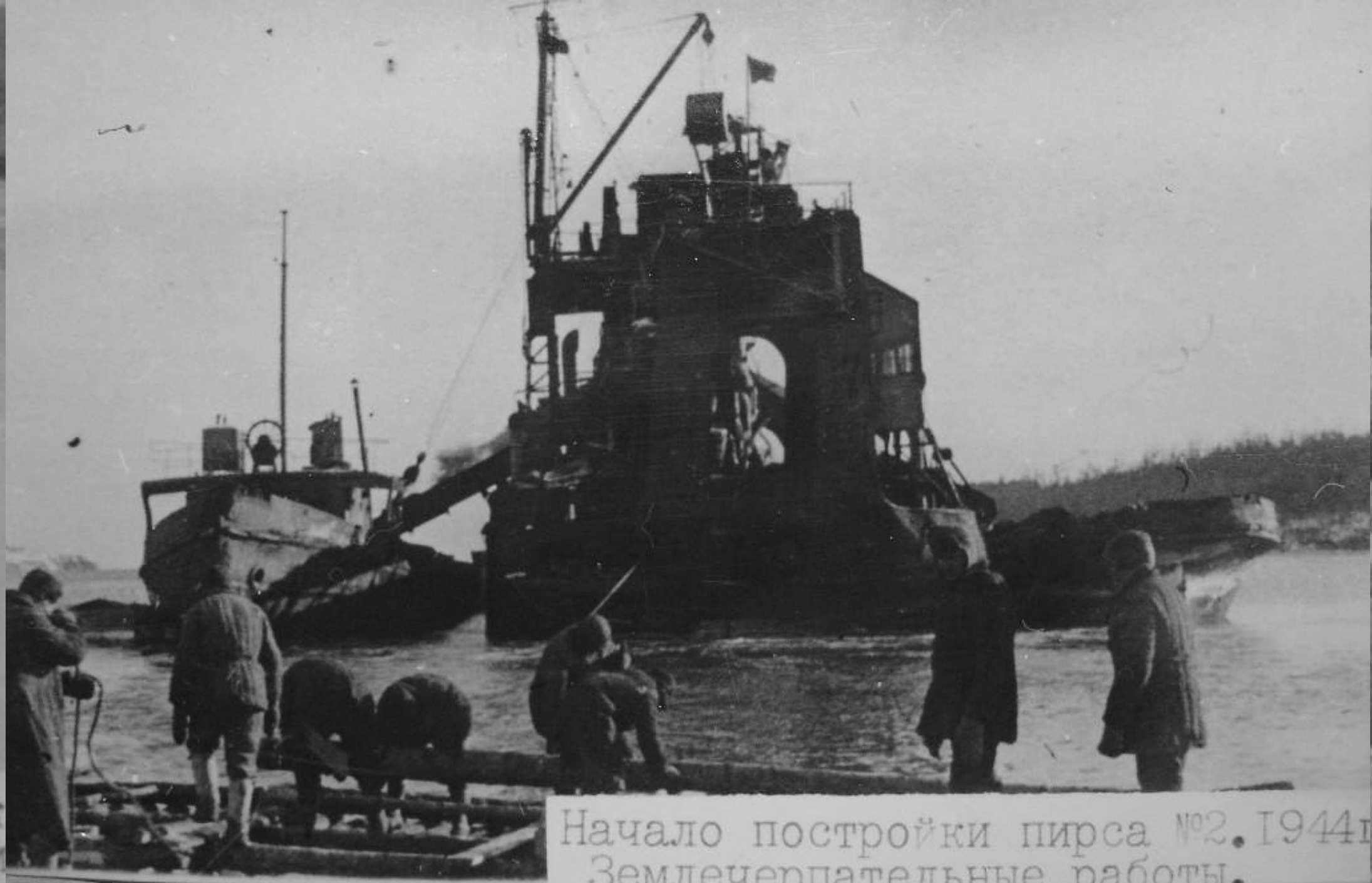
Начало постройки пирса №2. 1944г. Землечерпательные работы.