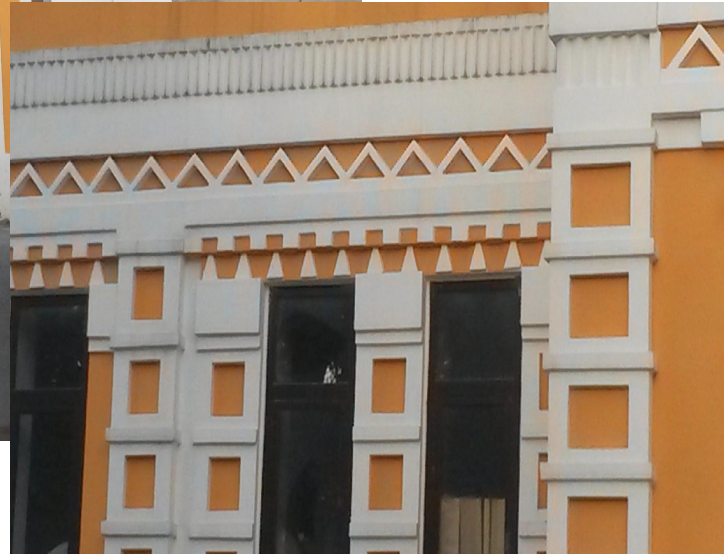
Дом- дача Хлудовых