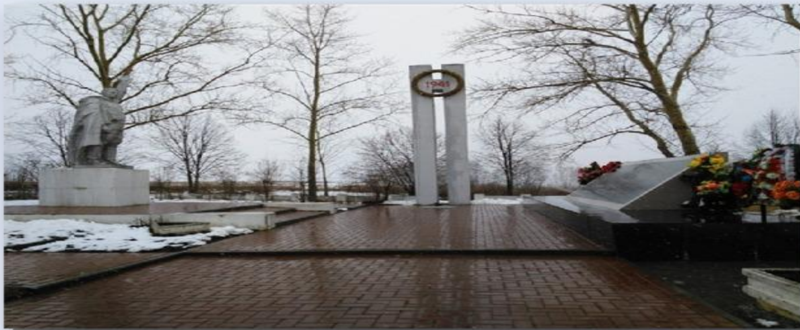
Памятник воинам освободителям на Черной горе