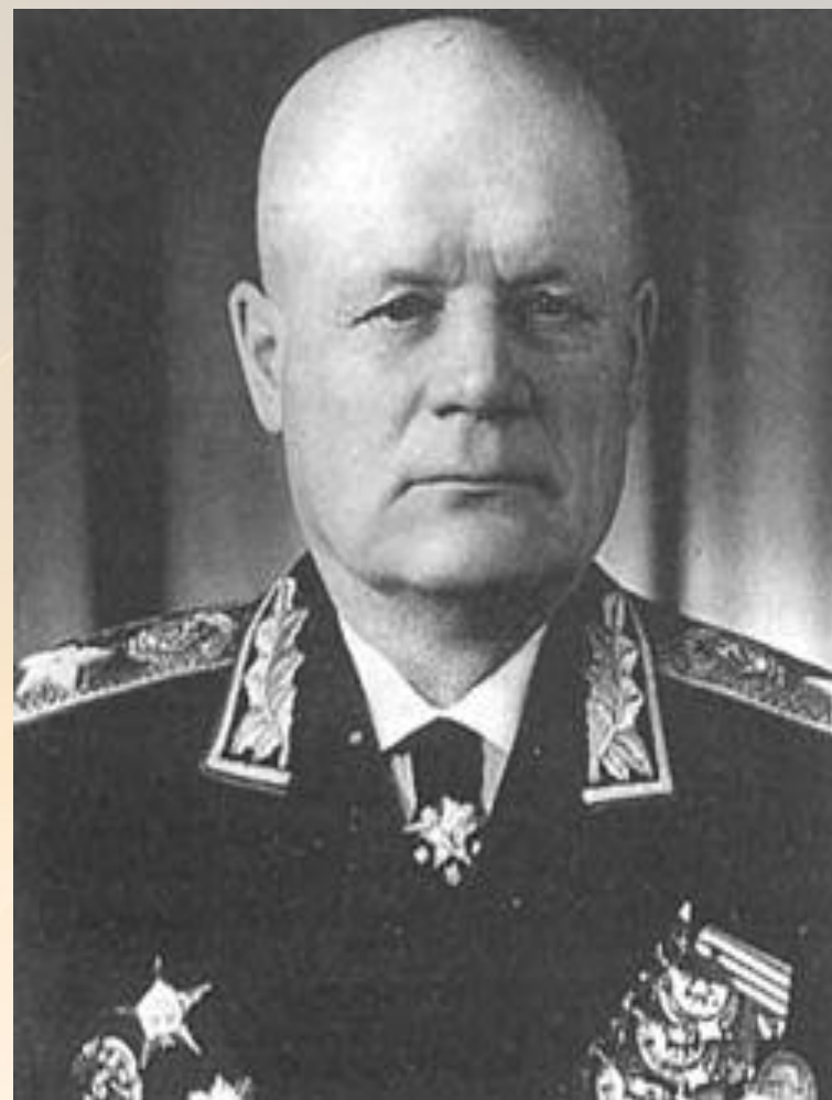
Голиков Филипп Иванович- командующий 10-й армией Западного фронта

«Поднявшаяся с утра метель скрыла походные колонны и от наземного, и от воздушного противника. Однако с выходом 330-й дивизии на заданный рубеж оборвалась связь командира дивизии полковника Г. Д. Соколова со штабом армии. Не было связи и с 328-й дивизией, вместе с которой предстояло брать Михайлов.