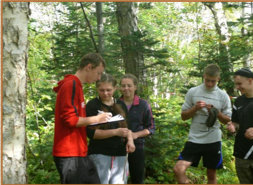
Геоботаника: описание растительности