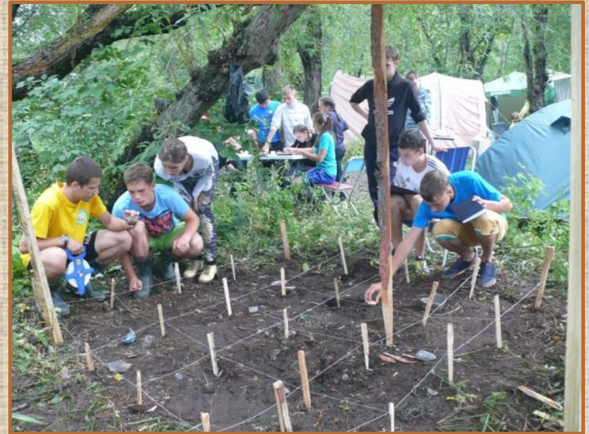
Полевая археология: план раскопа