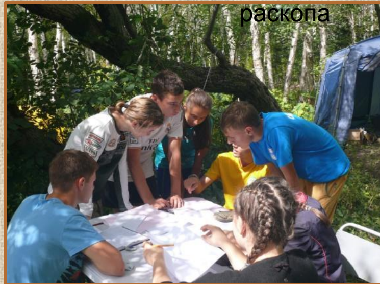
Полевая археология: рисунок