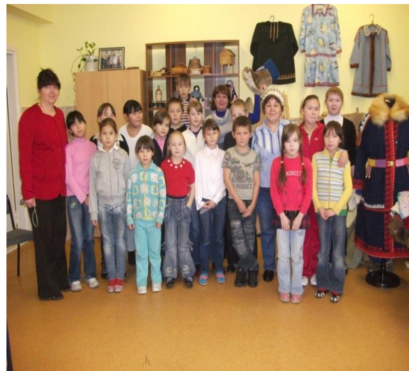
Экскурсия. Одежда коренных народов Севера