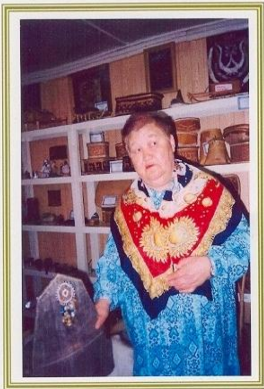
Учитель родного языка Корликовской школы.