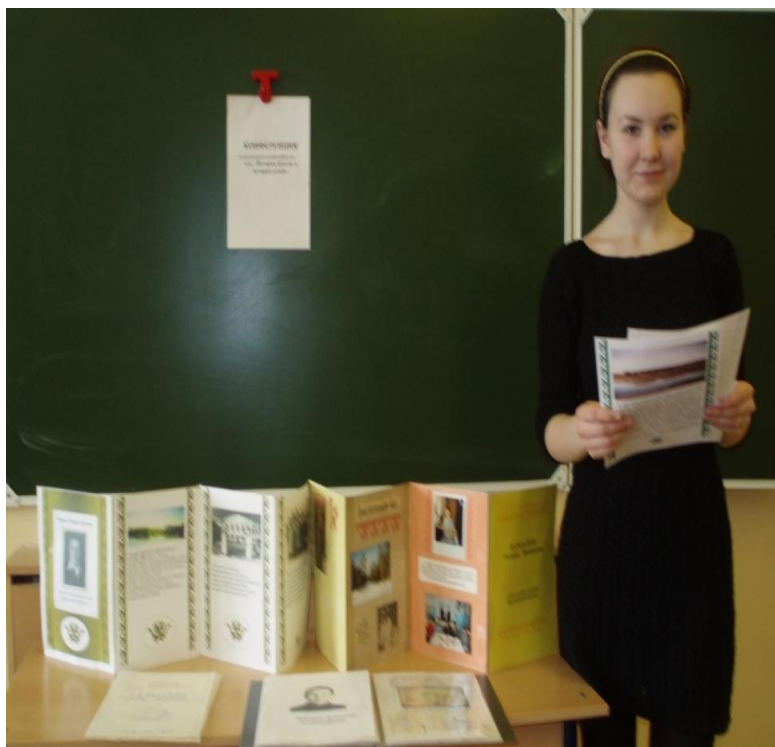
Конференция на тему «История школы в истории судеб».