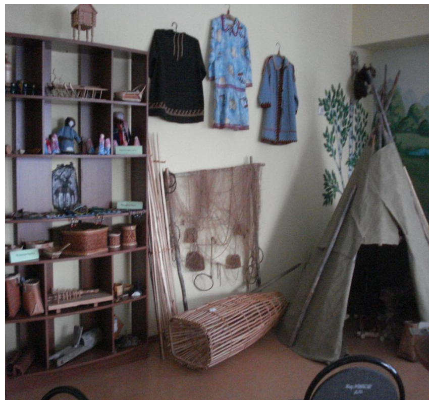
Экспозиция «Культура и быт народа ханты»