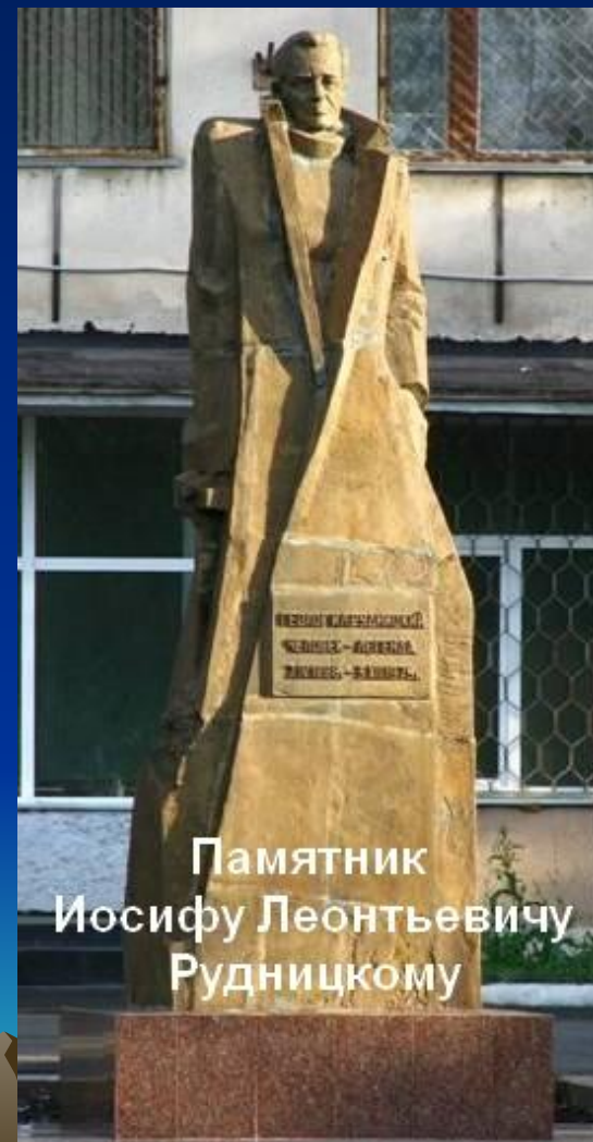
Памятник Иосифу Леонтьевичу Рудницкому